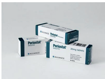
Slika 2. Periostat®, trenutno jedini komercijalno dostupan modulirajući agens

povišene tjelesne temperature. Mehaničkim djelovanjem NSAIL-a jest inhibicija enzima ciklooksigenaze, koji potiče proizvodnju medijatora upale, prostaglandina i tromboksana. Dva su tipa ciklooksigenaze: ciklooksigenaza-1 (COX-1) i ciklooksigenaza-2 (COX-2). COX-2 je proizveden u aktiviranim upalnim stanicama i smatra se enzimom koji potiče nastanak prostaglandinskih medijatora upale. Većina NSAIL lijekova koji se danas rabe u terapiji inhibiraju oba enzima. Sam protuupalni učinak posljedica je inhibicije COX-2 enzima. Kod oboljelih od parodontitisa, razina prostaglandina E2 (PGE2) povišena je u usporedbi sa zdravim pacijentima (9). PGE2 je proizvod različitih vrsta stanica kao odgovor na bakterijski LPS. Važan je čimbenik koji utječe na progresiju parodontitisa tako što potiče osteoklaste na resorpciju kosti (10). Klinička su istraživanja dokazala da upotreba NSAIL-a usporava gubitak alveolarne kosti (11). Brojnim je istraživanjima dokazano da svakodnevna sistemska upotreba NSAIL-a u razdoblju od tri godine dovodi do smanjenog gubitka kosti u odnosu na placebo skupinu (8, 2). Topikalnom primjenom NSAIL-a u vodicama za ispiranje usne šupljine smanjuje se razina PGE2 u tkivima te se održava razina alveolarne kosti (12). Da bi rezultati terapije bili optimalni, nužna je dugoročna dnevna upotreba NSAIL-a. S druge strane, ako se NSAIL upotrebljavaju duže vrijeme, imaju mnoš-