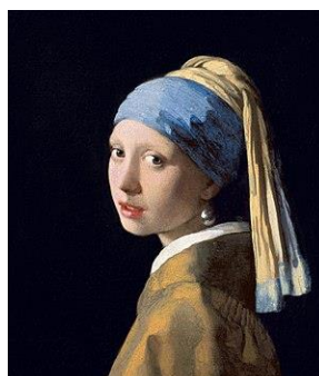
Slika 7. Djevojka s bisernom naušnicom, Jan Vermeer