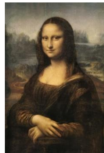
Slika 3. Mona Lisa, Leonardo da Vinci