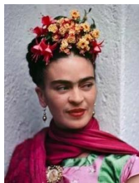
Slika 5. Frida Kahlo

O životu i djelu slikarice Fride Kahlo govorili smo na satima likovnog oblikovanja i duboko nam se urezala u sjećanje. Poslali smo joj i pozivnicu (slika 5).