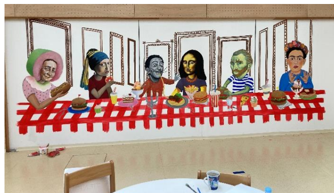
Slika 9. Završni dio slikarskog procesa (konačna inačica)