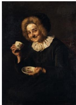
Slika 2. Kofetarica (Žena koja pije kavu), Ivana Kobilca

Prilikom određivanja broja osoba za stolom morali smo uvažiti dužinu zida kao slikarske podloge. Učenici su odabrali Kofetaricu (Ženu koja pije kavu) slovenske slikarice Ivane Kobilce (slika 2).