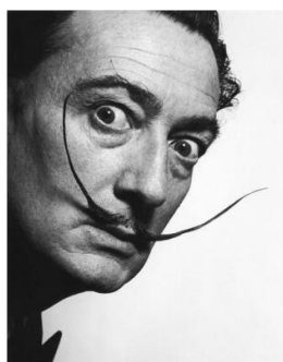
Slika 6. Salvador Dalí

Za stolom je ostalo mjesta još samo za dvoje, a to su španjolski umjetnik Dali, koji nas fascinira svojom maštom te neobičnim odnosno bizarnim, ali prekrasnim slikama (Slika 6) i nepoznata djevojka s bisernom naušnicom nizozemskog slikara Jana Vermeera (Slika 7).