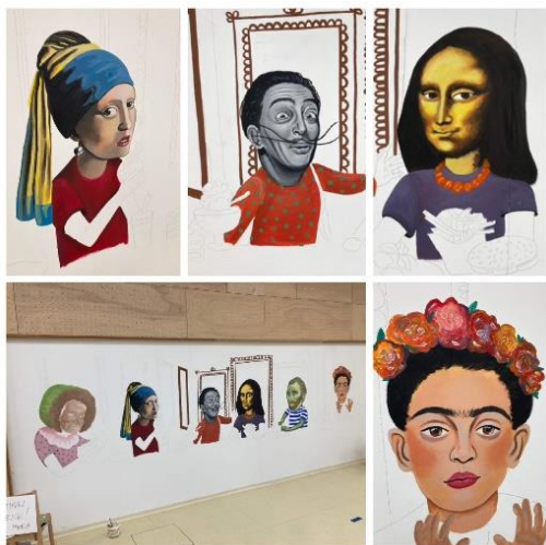
Slika 8. Proces stvaranja (kreiranja) slike