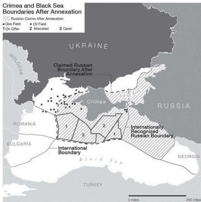
KARTA BR. 1 – Krim s teritorijalnim vodama i fosilnim izvorima (Metz, 2015).