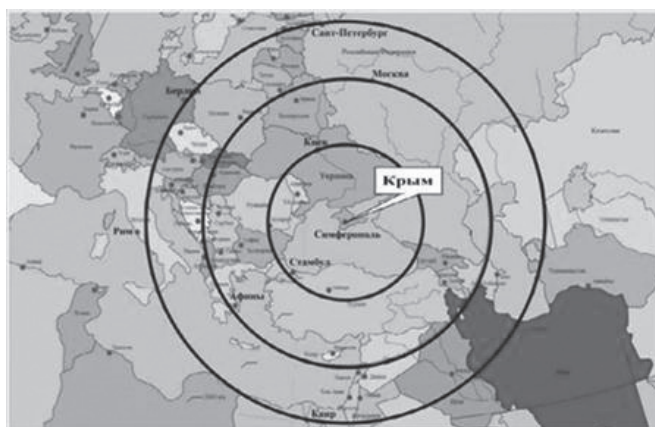
KARTA BR. 2 – „Grad Simferopolj je jednako udaljen od Istanbula i Kijeva (720 +/- 40 km), od Moskve i Atene (1200 +/- 40 km), od Kaira, Rima, Berlina i Sankt Peterburga (1600 +/- 40 km)“ (Евразийский Союз Ученых. 2014).