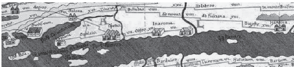
Sl. 1. Rimska cesta Salona – Inaronia sa Tabule Peutingeriane

svećen je prezbiter Paulin, prezbiter Stjepan postao je biskupom Mukura, a prezbiter Celijan, odnosno Cecilijan, biskupom Ludra. 2 Kao posljednji ovi su biskupi također supotpisali akta toga sabora. 3 U sastav Sarsenterske biskupije uključene su bazilike s područja delontinskog i stantinskog municipija, Rusticijarnih Novensa / Neuensa te Potuatika i Beuzavatika / Benzavatika. 4 Suvremena istraživanja ovu biskupiju locira-