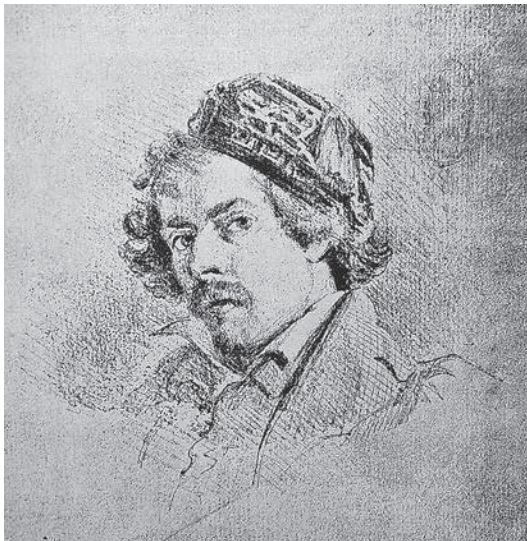
sl.7. J. J. Grandville: Autoportrait en bonnet , oko 1830. ili 1834., Zbirka Pierre Parizot, Nancy

Godine 1833. nacrtao je tintom i perom crtež Orchestre du Charivari 37 na kojem je prikazao suradnike časopisa kako sviraju razna glazbala. Sebe je prikazao kako svi-