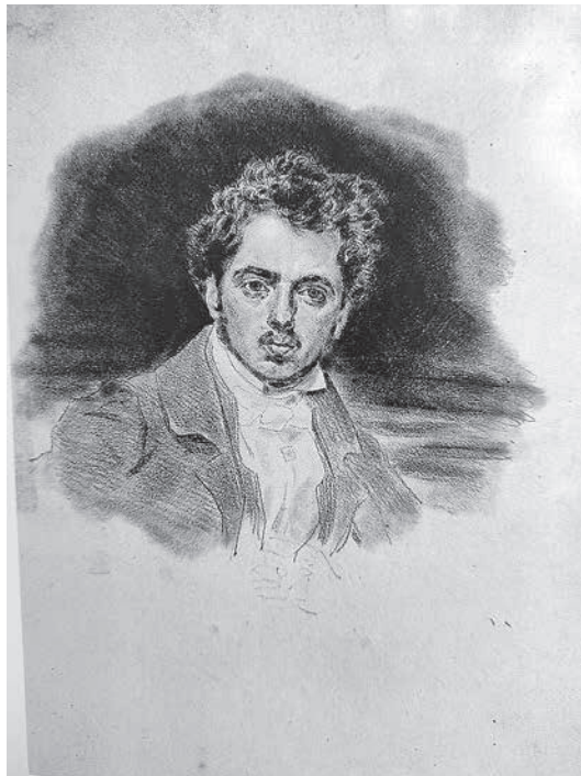
sl.3. J. J. Grandville: Autoportrait , oko 1824., Zbirka Pierre Parizot, Nancy