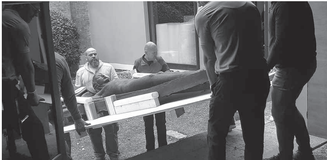
sl.12. Prijenos gipsanog reljefa Vječno razapef kroz vrt i atelijer