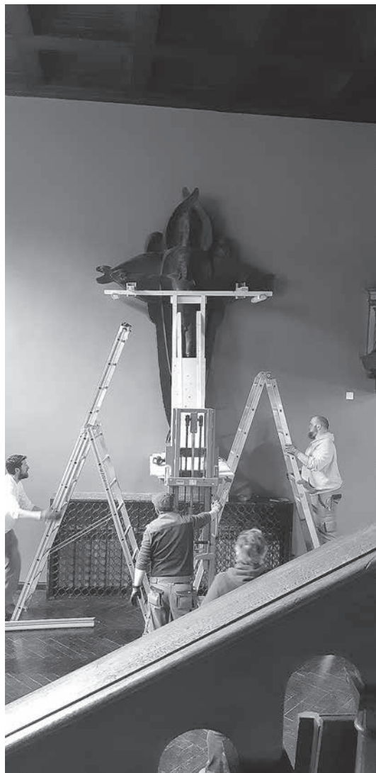
sl.8.-9. Spuštanje gipsanog reljefa Vječno razapef sa zida blagovaonice Atelijera Meštrović