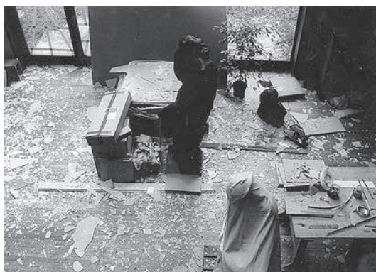
sl.5. Nekadašnji atelijer Ivana Meštrovića nakon uređenja 1963. godine prema projektu arhitekta Miroslava Begovića