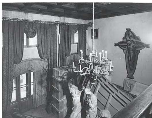
sl.1. Vjekoslav Cvetišić: Ivan Meštrović u blagovaonici u Mletačkoj 8 u Zagrebu