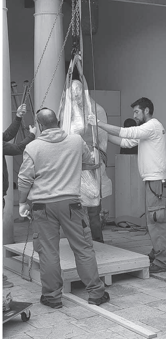
sl.10. Prenošenje kamene skulpture Na odmoru tzv. flašencugom – sustavom za podizanje kolotuum