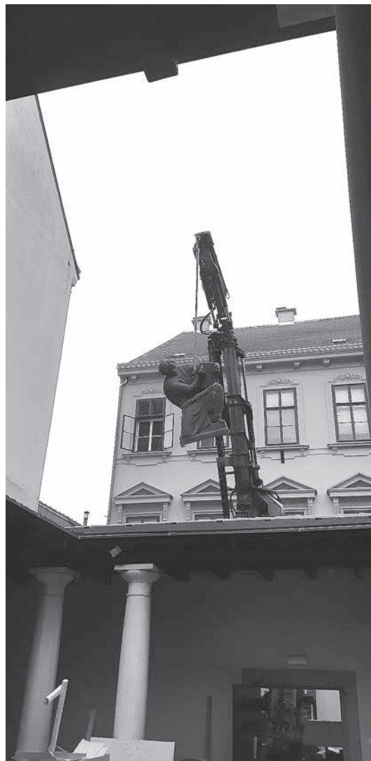
sl.7.b) Podizanje kranom brončane skulpture Miloš Obilić iz atrija Atelijera Meštrović