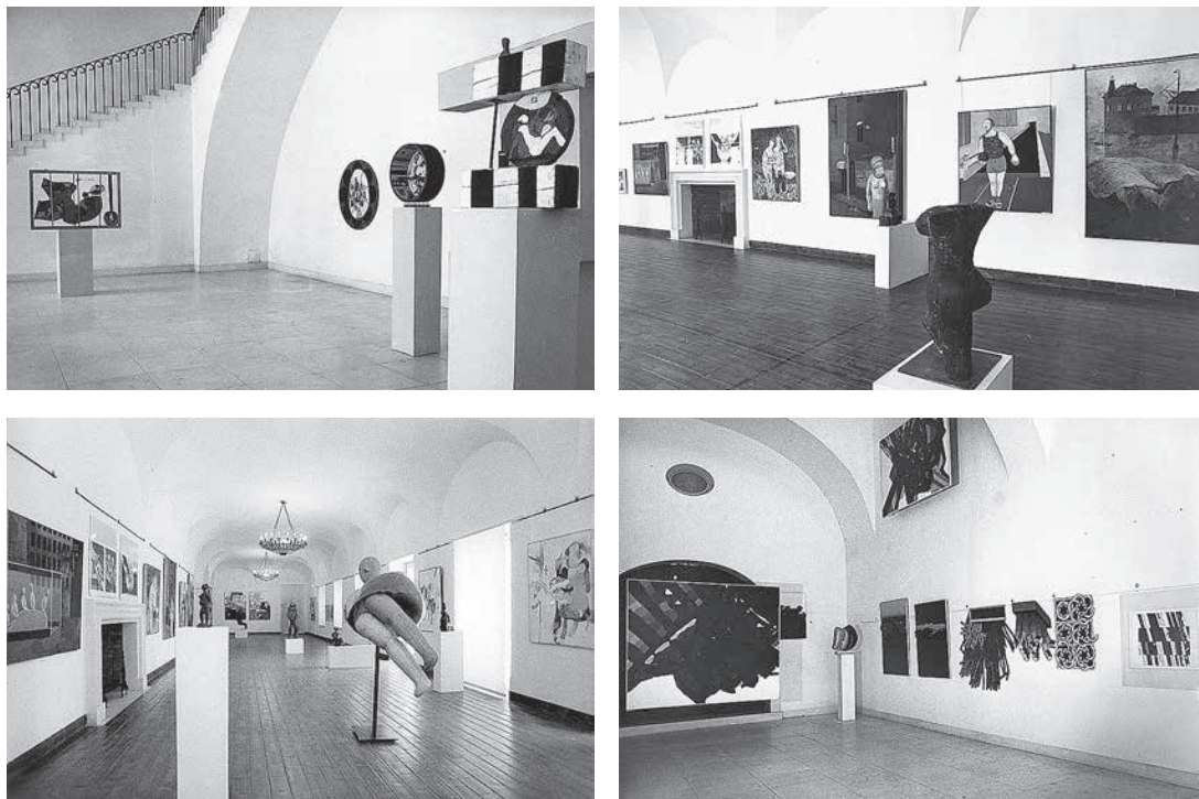
sl.26. Josip Škerlj, 1970.