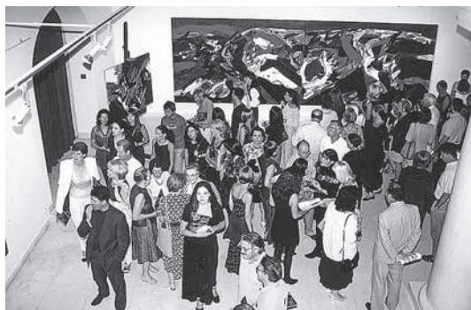
sl.30. Promocija monografije Đuro Pulitika autora Antuna Karamana, 1988.