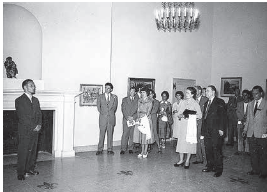
sl.19. Izložba srednjovjekovnih fresaka, 1959.