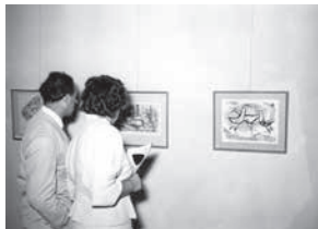
sl.17. Izložba suvremene litografije Sjedinjenih Država, 1956.