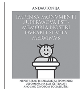
sl.7. Dizajn Likovni Studio