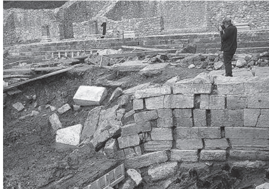
sl.6. D Nemeth-Ehrlich, V. Toplice istraživanja, 2011.