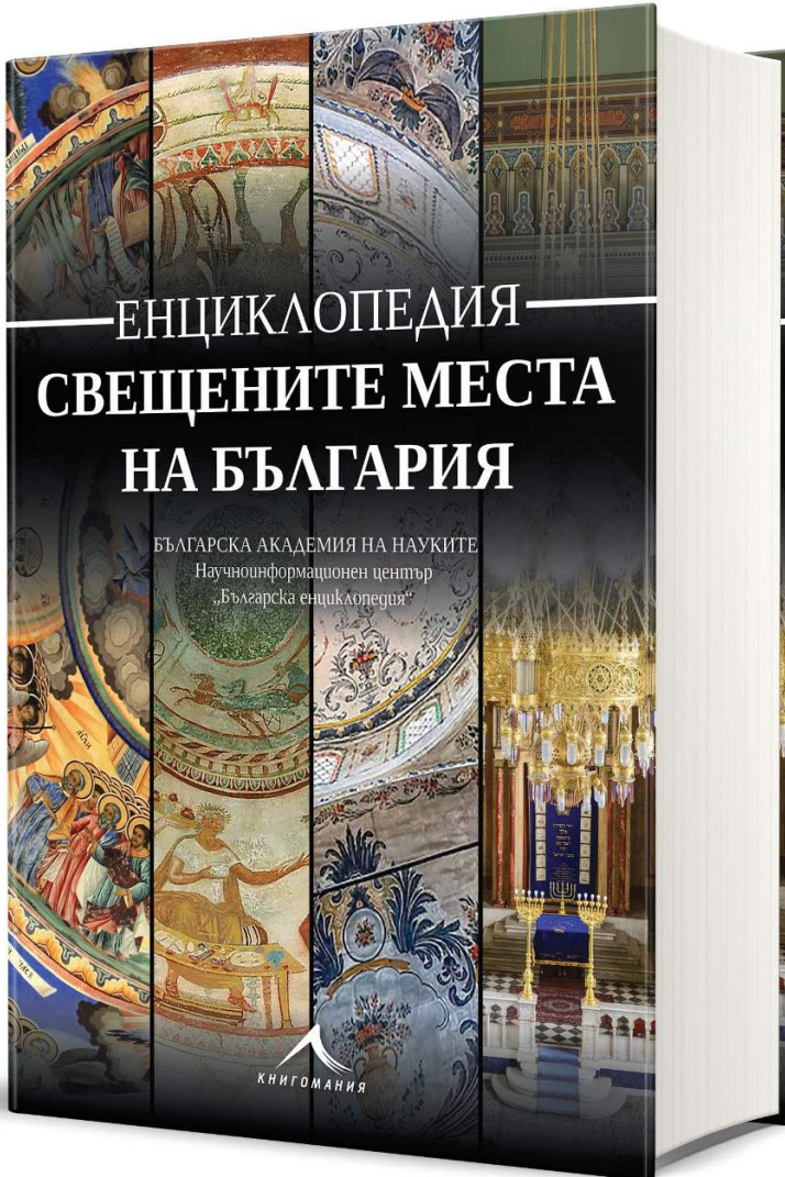
Encyclopedia Sacred Places of Bulgaria

graphic drawings: portraits, paintings, views, schemes. At the beginning of the 20 th century, encyclopedic material was also contained in some translated dictionaries. Specialised encyclopedic reference books appeared on the market: on economics, philology, literature, medicine, etc.