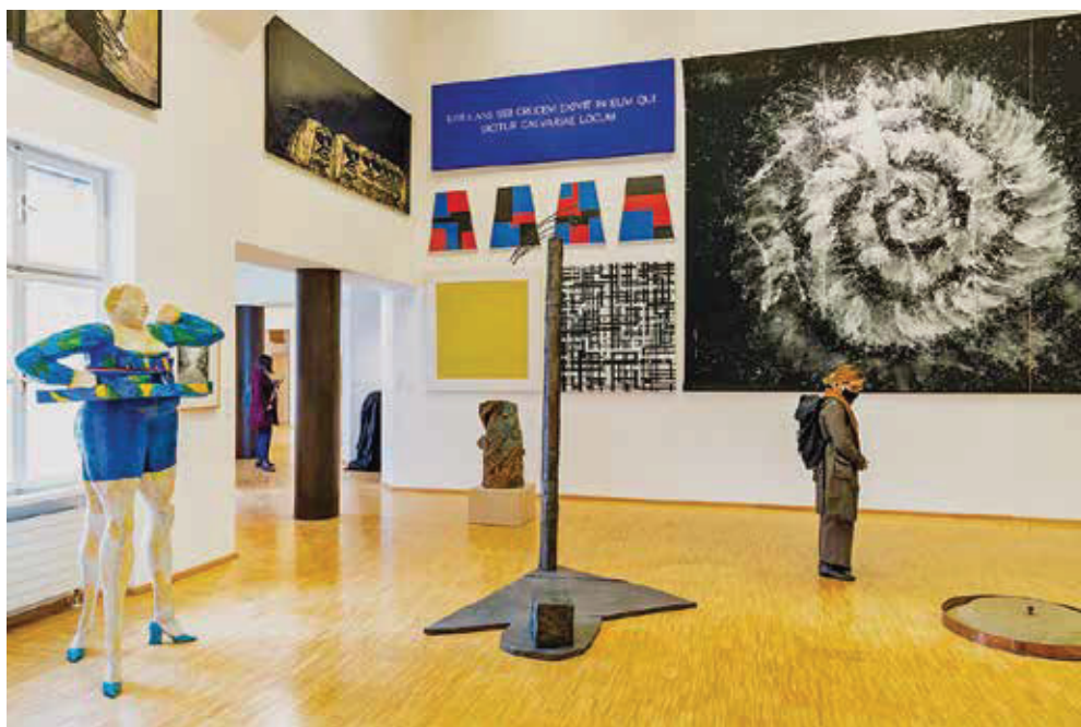
Slike 3 i 4. Novi stalni postav Nacionalnog muzeja moderne umjetnosti, od veljače 2021. do prosinca 2022. godine. Fotografirao Denis Bučar, 2021. Fototeka MDC-a.