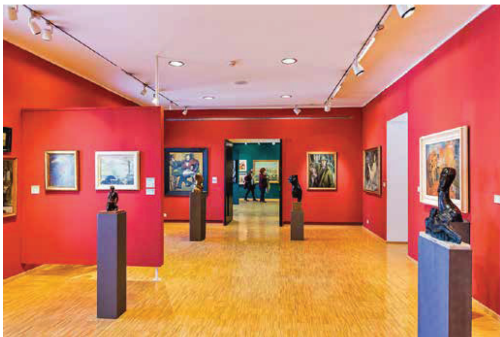
Slike 1 i 2. Novi stalni postav Nacionalnog muzeja moderne umjetnosti, od veljače 2021. do prosinca 2022. godine.