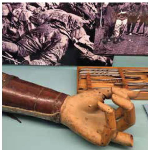
Slike 2 i 3. Odlikovanja nadvojvode Franje Ferdinanda koja je nosio na dan ubojstva u Sarajevu i proteze iz prve polovice 20. stoljeća.

tekstil i papir) za potrebe stalnog postava izrađene su kopije koje nisu pribrojene broju predmeta iz zbirki. Ukupno ih je u postavu oko dvije stotine.