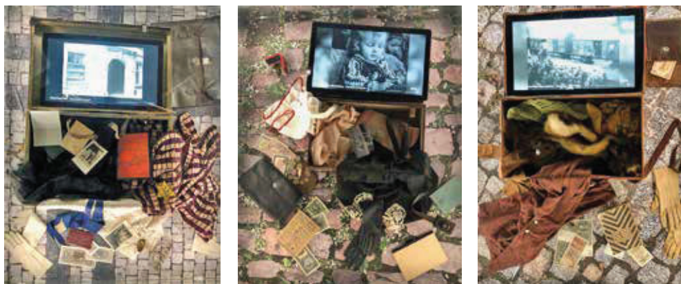
Slike 5 – 7. Prisilne deportacije Židova, Čeha i Nijemaca sredinom 20. stoljeća.

čeških stručnjaka za povijest 20. stoljeća. Njegovi su članovi stalno komentirali libreto (u češkoj muzeološkoj praksi faza nakon muzeološke koncepcije), scenarij i izložbene tekstove. Konačni oblik tekstova