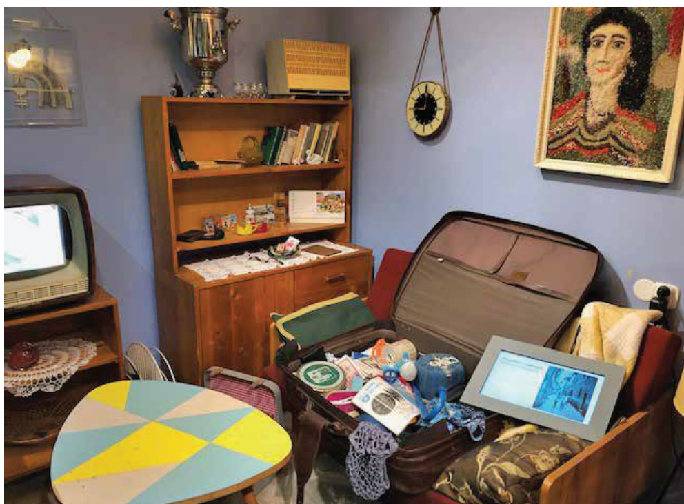
Slike 10 – 12. Privatni interijeri.