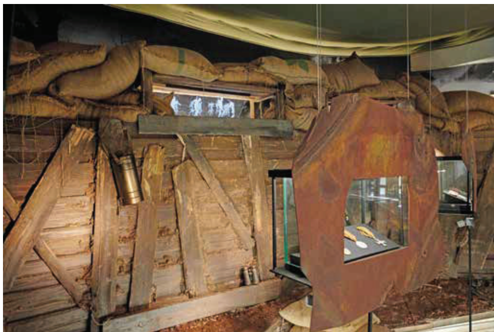
Slika 1. Postav počinje s Prvim svjetskim ratom.