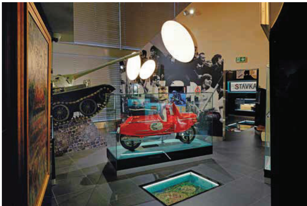
Slika 8. Tenk kojim je gušena sloboda.

potom je objedinio povjesničar i novinar dr. sc. Martin Groman tako da ostanu stručni, ali da istodobno budu napisani što prikladnijim jezikom za posjetitelje.