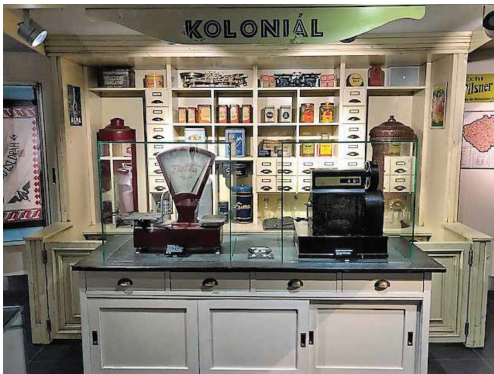
Slika 9. Interijer prodavaonice.

postupno na sebe naslagao tematske slojeve povijesti 20. stoljeća. Nakon rasprava između autorskog tima i arhitekata došlo je do izmjena, te su u prostor uklopljeni opsežni arhitektonski objekti – „sante“ koje su slobodno postavljene u prostoru. Ti su elementi nositelji većine tekstnih i slikovnih informacija, a ujedno su vitrine s muzejskim predmetima. Svaka vitrina ima drukčije dimenzije, osmišljene prema dimenzijama konkretnih predmeta, što je zahtijevalo i posebno postavljanje, pri čemu se posebna pozornost posvećivala svakom predmetu. Svaka „santa“ ujedno je i jedna tema u postavu. Važna je i vrsta površine „santi“: crna je, s visokim klavirskim sjajem. Ona odražava ostale dijelove postava (grafike i predmete zbirke), a ujedno i posjetitelja koji tako postaje dio