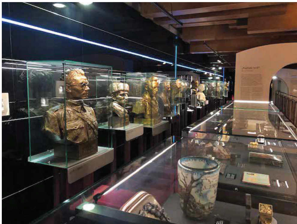
Slika 16. Galerija bisti čeških političara.

Stvarna izvedba trajala je oko petnaest mjeseci, a najzahtjevnije je bilo pitanje logistike materijala i predmeta iz zbirke te ideja dizajna u sučeljavanju s praktičnom obrtničkom izradom jer se radilo o izrazito netipičnoj građevini (npr. savijanje gips-kartonskih ploča u vodoravnome i okomitom smjeru, naglasak na čistoći fuga, simetriji i sl.) i u građevinskom smislu i u smislu muzejskih i galerijskih postava. Unatoč početnoj nespojivosti realizacijskih ideja, konačna je forma uspjela i oblikovno ispunjava svoju ulogu. S praktične strane postav je pripremljen za dugotrajno funkcioniranje: „sante“ i zasebne vitrine opremljene su izmjenjivim apsorpcijskim kasetama za kontrolu mikroklimatskih uvjeta, muzejski predmeti koji se ne mogu trajno izlagati pripremlje-