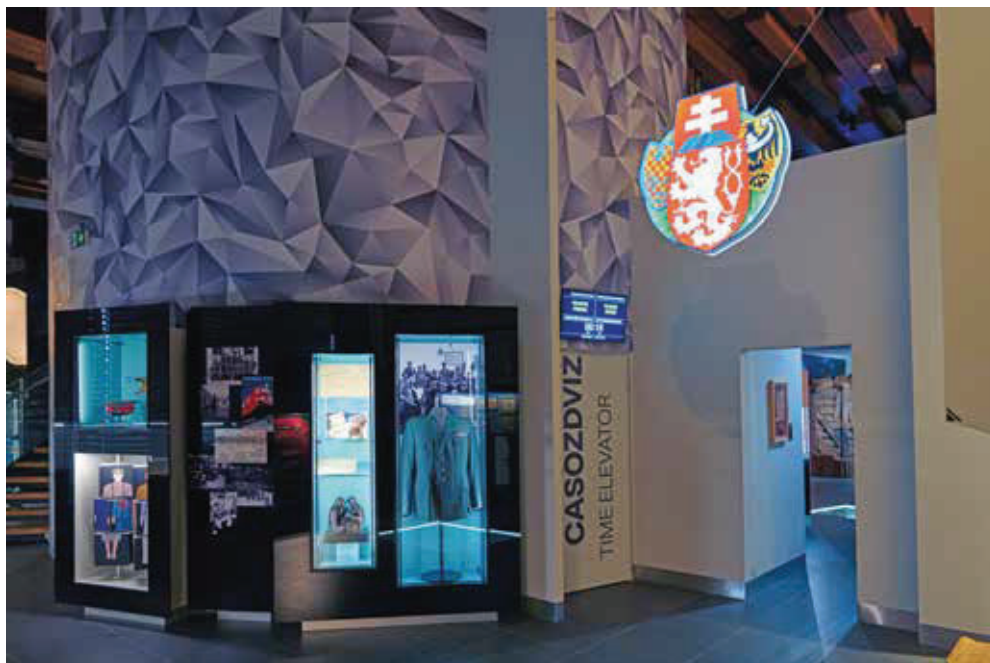
Slika 4. Ulaz u „kapsulu“ multimedijskog vremeplova.

Tijekom pripreme stalnog postava važan je bio i način stručnih savjetovanja i dorade završnih tekstova. Sastavljen je savjetodavni tim od trinaest vodećih