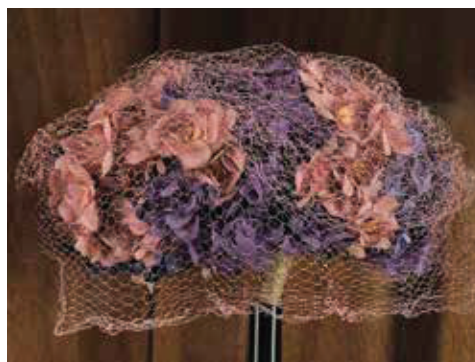
Slika 15. Francuski šešir prve dame Hane Benešove, kasne tridesete.

Audiovizualni elementi djelomično su osvijetljeni, posebno u području posvećenom politici. Posjetitelji mogu prelistati političke afere, ali i pogledati rezultate izbora u 20. stoljeću. U ovom dijelu taj je element poseban. Ilustriran je, nastao na