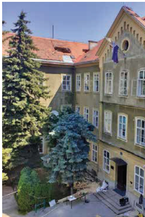
Slika 2. Palača Hidrometeorološkog zavoda, Grič 3 – pogled na unutrašnje dvorište.