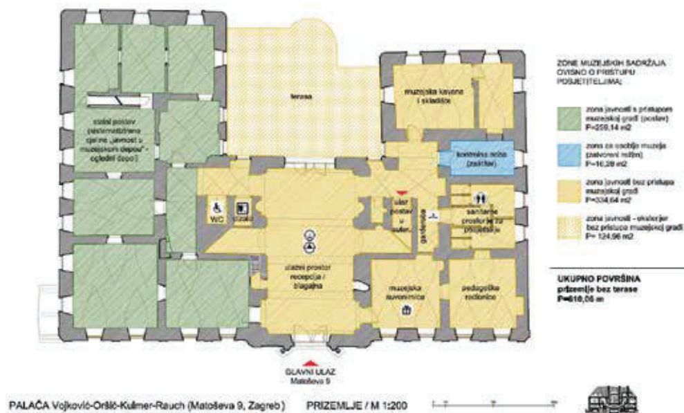
Slika 5. Radno zoniranje palače Vojković-Oršić-Kulmer-Rauch tijekom rada na stalnom postavu (tlocrt prizemlja)