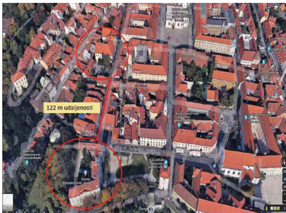
Slika 3. Udaljenost palače Vojković-Oršić-Kulmer-Rauch od palače Hidrometeorološkog zavoda

među kojima je najizgledniji bio projekt rekonstrukcije i prenamjene objekta Tvornice duhana Zagreb (Jagićeva b. b.) koju je Vlada Republike Hrvatske kupila 2007. godine. Pritom treba istaknuti da je koncepcija stalnog postava iz 2012. godine, koja je načinjena za taj projekt, bila temelj za izradu novoga muzeološkog programa 2021. godine. 8