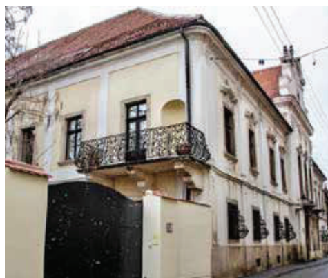
Slika 1. Palača Vojković-Oršić-Kulmer-Rauch, Matoševa 9.

Višedesetljetna nastojanja i pokušaji ostvarenja stalnog postava te cjelokupnog djelovanja Hrvatskoga povijesnog muzeja u primjerenom prostoru dobili