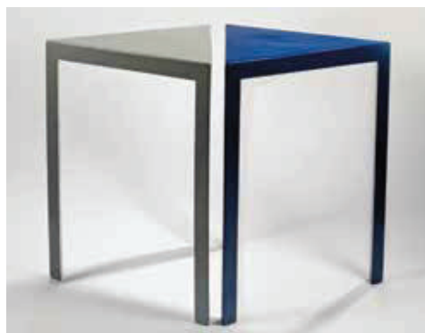
Slika 4. Trokutasti stolovi Janine Grossman i Irene Reicherówna, tvornica obojenog namještaja Meko, 1929. – 1933.

Druga cjelina je najmanja i posvećena je Izložbi dekorativnih umjetnosti i moderne industrije u Parizu 1925. godine. U njoj smo okupili predmete i arhivske materija-