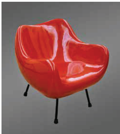
Slika 7. Naslonjač Romana Modzelewskoga, 1958.

Lubomira Tomaszewskoga, na primjer, ima dekorativne, skulpturalne kvalitete (sl. 6). Velik dio predmeta izloženih u ovom dijelu, posebice namještaja, zapravo nije masovno proizveden, već je izrađen u samo nekoliko komada jer je gospodarstvo bilo usmjereno na potporu teškoj industriji i nije poticalo uvođenje novih tehnologija u lakoj industriji, uključujući izradu namještaja. Stoga se izrazito estetske plastične stolice koje su postale ikone zapadnog dizajna nisu mogle proizvesti i popularizirati u Poljskoj. U postavu prikazujemo njihove modele i prototipove, primjerice naslonjač Romana Modzelewskoga (sl. 7). Razdoblje od 1970. do 1989. godine predstavljeno je šestom cjelinom u kronološkom dijelu stalnog postava, nazvanom Pokušavajući ići ukorak sa svijetom: nedostaci i ograničenja , te promatranom kroz prizmu gospodarske krize sedamdesetih godina. Obilježja su tog razdoblja ugušena proizvodnja, ozbiljna nestašica robe i opći pad poljskog dizajna, ali za-