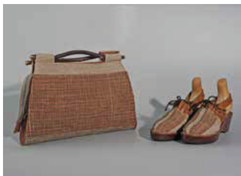
Slika 5. Torbica i cipele Krystyne Tołłoczko-Różyške, BNEP, 1945. – 1947.