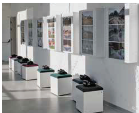
Slika 11. Stalni postav Arheološkog parka Iovia Ludbreg.