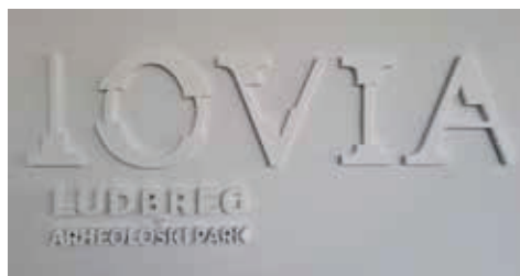
Slika 5. Logotip Arheološkog parka Iovia Ludbreg. Fotografirala Tajana Pleše, 2021.

Projektom rješenjem obuhvaćena su dva dijela arheološkog parka (prezentirano nalazište i objekt u kojemu je smješten interpretacijsko-didaktički stalni postav s centrom za posjetitelje) koja su dizajnerskim rješenjima povezana u cjelinu (sl. 5). 15 Odabrana su minimalistička, vizualno atraktivna, zabavna i oku ugodna rješenja, koja omogućuju posjetitelju lako dobivanje informacija. Primijenjena rješenja (od oblikovanja interakcija i proizvoda do prostornog uređenja i doživljaja te informacijskog oblikovanja) u osnovi su vrlo funkcionalna, ekonomična