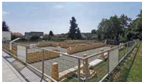
Slika 13. Prezentirane rimske građevine.

Svi hodni slojevi unutar antičkih objekata izvedeni su u visinama potvrđenima istraživanjima od materijala otpornih na atmosferilije 22 (bez obzira na to jesu li se prezentirane podnice nalazile u interijeru ili na otvorenome). S obzirom na činjenicu