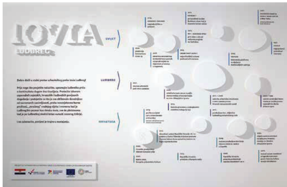
Slika 7. Stalni postav Arheološkog parka Iovia Ludbreg.

Prostor je nenametljivo naglašen posebno projektiranim vitrinama kojima je omogućena skladna vizualna prevlast konzerviranih i restauriranih pokretnih arheoloških nalaza (keramičkih, metalnih i staklenih uporabnih predmeta te novca) koji su usklađeni s usporednom lentom povijesnih zbivanja. Odabirom