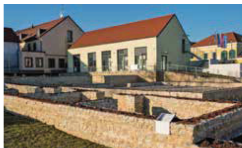
Slika 6. Interpretacijsko-didaktički stalni postav s centrom za posjetitelje.

Bivši zapadni, nenatkriveni kolni ulaz ovog objekta prenamijenjen je u prostrani ulaz u park koji s južne strane određuje providna barijera (koja omogućuje pogled na nalazište i izvan radnog vremena