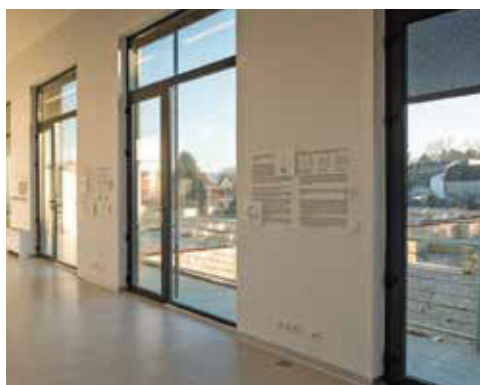
Slika 10. Stalni postav Arheološkog parka Iovia Ludbreg. Fotografirala Tajana Pleše, 2021.

(sl. 10 i 11). U tome prostranom, svijetlom dvoetažnom prostoru obrazloženje pronađenoga (te njegov prostorni i povijesni kontekst) oblikovano je jasnim rješenjima dizajna informacija s pomoću nekoliko vrsta interpretacijskih medija (tekstom, usporednim fotografijama „prije i nakon“ te grafičkim prikazima). S druge su strane u light box vitrinama prikazane usporedne fotografije nalazišta nakon istraživanja i idealne 3D rekonstrukcije učinjene iz istog rakursa. Posebnost ovog prikaza čini prijelazni prikaz, u kojemu su vidljive konstrukcije objekta, što posjetitelju olakšava razumijevanje (sl. 12). 20 Idealnu rekonstrukciju arhitekture moguće je doživjeti i VR naočalama.