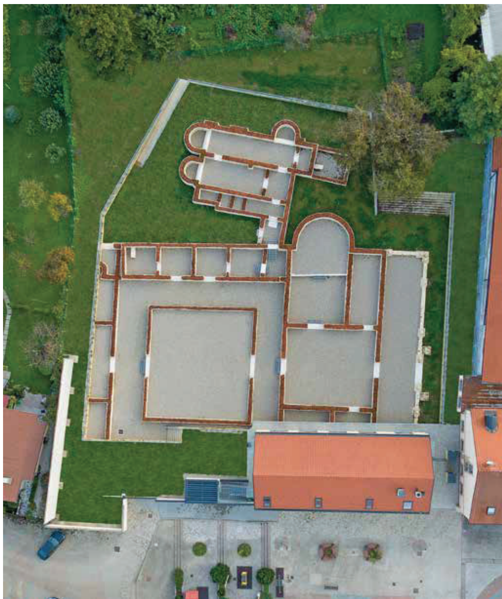
Slika 16. Arheološki park Iovia Ludbreg. Fotografirao Skimi64, 2020.

Oko cijelog prostora arheološkog parka postavljena je mrežasta ograda uz koju su, u skladu s projektom hortikulturnog uređenja, posađene zimzelene penjačice (trolisne lozice i bršljan) te listopadni grmovi raskošnih cvjetova (purpurna rujevina, bazga, jorgovan, hortenzije i hudika), uskla-