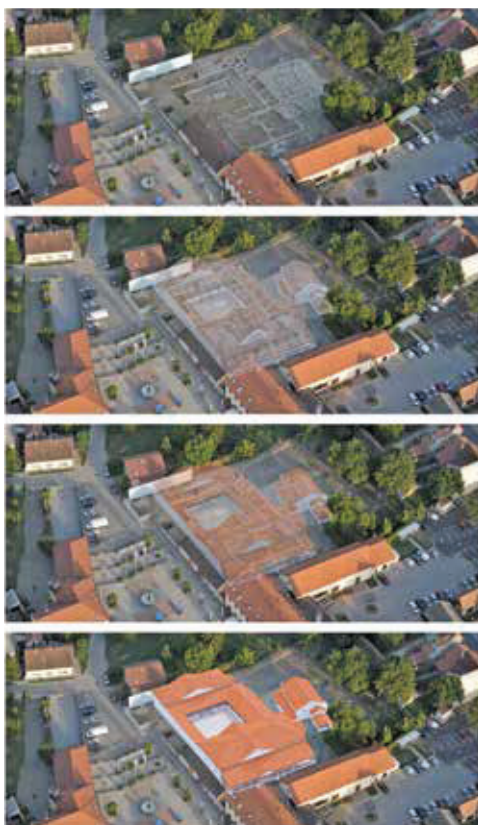
Slika 12. Idealna 3D rekonstrukcija rimskih građevina. Izradili Tajana Pleše, Marko Zeko i Ljubo Gamulin, 2021.

Iz južnog dijela stalnog postava ulazi se u nalazište s njegove sjeveroistočne strane. S obzirom na činjenicu da je istražena arhitektura većinom sačuvana u visini temelja, bilo je potrebno odlučiti koji će oblik predstavljanja posjetiteljima biti najjasniji. Cjelovita i wireframe rekonstrukcija odbačene su zbog nedostatka podataka te zbog financijske zahtjevnosti. Parterno prezentiranje i postavljanje nadstrešnice nad istraženim strukturama nije usvojeno zbog nedostatne čitkosti te dugoročno vrlo zahtjevnog održavanja. S obzirom na jasno određene vrijednosti nalazišta, odbačena je i ideja ponovnog zatrpavanja. Stoga je