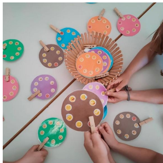
Slika 2. Djeca biraju emocije

Kod djece nižih razreda osnovne škole gotovo svakodnevno opažam osnovne (radost, tuga, ljutnja, strah) i složene emocije (ponos, sram, krivnja, zavist). Budući da sam željela da učenici osvijeste svoje emocije te da znaju prepoznati i artikulirati svoje osjećaje, napravila sam im »krug emocija«. Prvo smo razgovarali o značenju svakog simbola, objasnili ga i pokušali pokazati i imenovati. Svaki je učenik dobio svoj »krug emocija«.