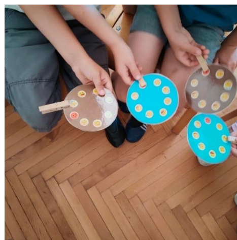
Slika 4. »Kako se ti osjećaš?«

Učenici zatim stave štipaljku gdje misle da je prikladno, ovisno o tome kako se osjećaju. Zatim razgovaramo o njihovom izboru. Ponekad žele prebaciti svoj izbor na drugu emociju, a dođe i dan kada ne žele govoriti o svojoj emociji i treba im vremena da budu spremni artikulirati je. Ponekad razgovaraju o svojim izborima s prijateljem ili u maloj grupi, a ponekad sjedimo u krugu i svi zajedno razgovaramo o njihovim osjećajima.