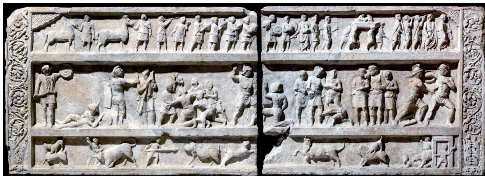
Slika 2. Reljef s gladijatorima, 20. - 50., Nacionalni arheološki muzej u Napulju, Italija

Sljedeća teorija također govori kako su gladijatorske borbe izvorno imale sakralni karakter. Radi se o vjerovanju kako su rimski vojnici, nakon svoje smrti, bili počašćeni žrtvom ratnih zarobljenika, a slične manifestacije provodili su i Grci te Etruščani. 3 Slična razmatranja donosi ranokršćanski pisac Tertulijan u svom djelu De spectaculis , napisavši: „Drevni su mislili kako s ovakvim spektaklom čine uslugu mrtvima, nakon što su to ublažili kulturnijim oblikom okrutnosti... Jer su od davnina, u uvjerenju kako se duše umrlih pomiluju ljudskom krvlju, na sahranama žrtvovali zarobljenike ili robove loše kakvoće koje su kupili... Tako su u ubojstvu našli utjehu za smrt“. 4 Prema toj teoriji praksa jednostavnog žrtvovanja prerasla je u međusobnu borbu do smrti, što bi s vremenom preraslo u gladijatorske borbe.