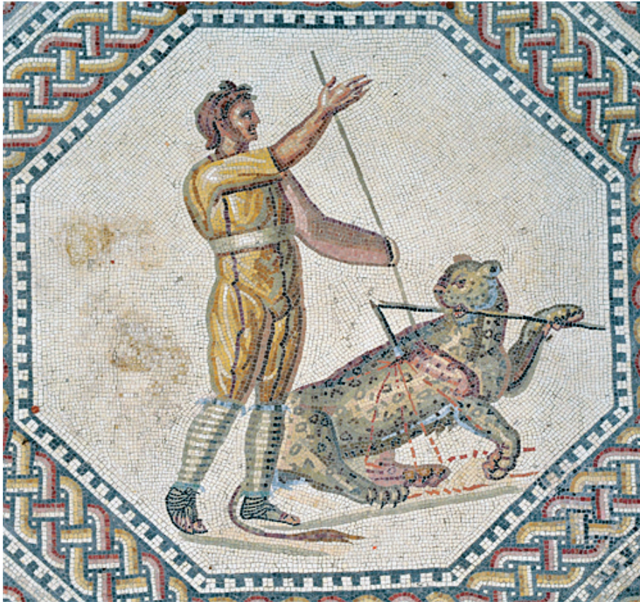
Slika 7. Prikaz bestiariusa s mozaika iz vile Nennig, Austrija

Bestiarius - borci koji su se borili protiv životinja, poznati kao i lovci. Manje cijenjeni od pravih gladijatora; također, tehnički nisu bili smatrani gladijatorima. O njihovoj opremi ne mogu se donijeti konačni zaključci zbog oprječnih nalaza. Naime, reljefi iz republičkog razdoblja prikazuju potpuno naoružane gladijatore koji se bore s divljim životinjama, ali u carskom razdoblju bestiariusi su se borili s kopljem i bez oklopa. 17