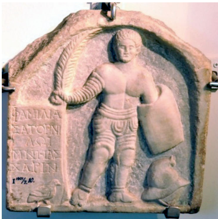
Slika 5. Nadgrobni spomenik gladijatora, 3 st., Nacionalni muzej starina, Leiden, Nizozemska

Mnogi političari i carevi kasnije će shvatiti kako je rimsko stanovništvo željno ovakvih borbenih uzbuđenja, što su koristili kako bi povećali vlastitu popularnost, raznim sponzoriranjem gladijatorskih igara. Pri samom vrhuncu igara, rimski carevi sponzorirali su borbe u kojima su sudjelovali mnogobrojni gladijatori. Nadgrobni spomenik gladijatora koji nosi pobjednički palmin list govori u prilog vrijednosti gladijatora, a na njemu se nalazi i natpis na grčkom, čiji prijevod donosi Wiedemann 12 te on glasi: „The Familia [erected it] to Satornilos, to remember him.“ 13 Spomenik je pronađen u Anatoliji, a danas je dio Arheološkog muzeja u Leidenu, Nizozemska.