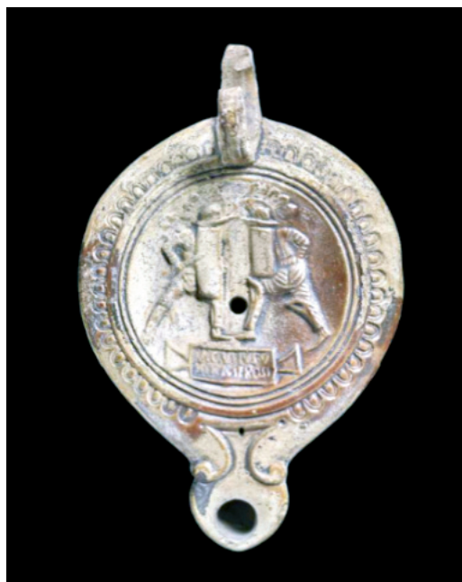
Slika 3. Svećiljka od terakote s prikazom dvaju gladijatora 51. - 100., Britanski muzej

grčkoj mitologiji Kron, također s vlastitim festivalom zvan Kronia , održavan u njegovu čast i za žetveno slavlje. Kronia se posebno slavila u Ateni i drugim jonskim gradovima i to preko ljeta. Saturn, jednako kao i Kron, jest otac vrhovnog boga Jupitera, čiji je grčki pandan Zeus. Obojica će svrgnuti oca kako bi zauzeli mjesto vrhovnog boga. Istaknuta teorija ima nekoliko nepodudaranja koje su očite u samom obilježavanju spomenutih festivala. Naime, na dan Kronije , uobičajene društvene razlike bile su poništene, a robove bi njihovi gospodari gostili i dopuštali im divljati gradom, stvarajući buku, koliko god su htjeli, te se slični obrasci ponavljaju i u Rimu. 5 Ipak, Grci su Krona često poistovjećivali s neugodnim stranim božanstvima poput Moloha, semitskog boga kojem su pri-nošene ljudske žrtve. 6 Potonje tumačenje čašćenja navedenog boga govori u prilog istaknutoj teoriji. Također, možemo pridodati i trodnevne smrtonosne borbe koje je u Rimu organizirao Tit Flaminin, a koje su se preklapale s navedenim festivalom Saturnalija . 7 Tada je Tit suprotstavio 74 muškarca, što samo pokazuje razvijenost gladijatorskih borbi, ali se može povezati i s ljudskim žrtvovanjem.