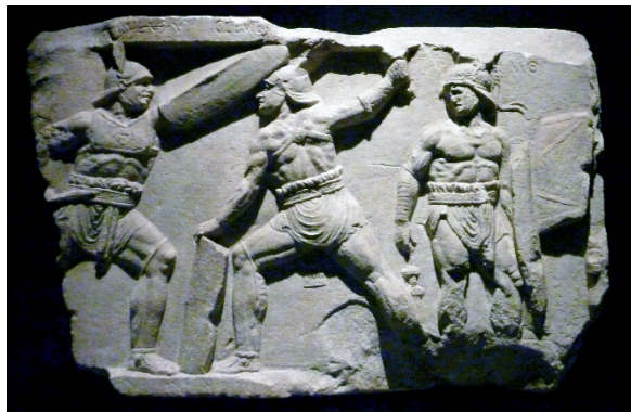
Slika 8. Reljef nadgrobnog spomenika s prikazom dvojice republičkih provocatora. Rim, oko 30. pr. Kr.

Provocator - čije ime znači „izazivač“, bio je opremljen otprilike na isti način kao i murmillio : sa šljemom, pravokutnim štitom, štitnikom za ruku i okloпом. Glavno oružje bio mu je kratki mač. Natpisi koji spominju ovakav tip gladijatora poznati su iz Rima (Anicetus i Par-dus), Pergama (Nympheros) i Pompeja (Mansuetus). 21