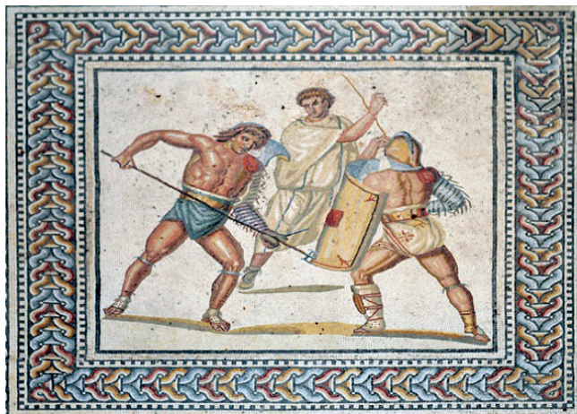
Slika 9. Prikaz borbe retiariusa i secutora na mozaiku iz vile Nennig, Austrija

Navedeni tipovi gladijatora nisu sve inačice ovih antičkih boraca, već samo najpoznatiji. Primjetno je kako su pojedine vrste gladijatora dobile ime prema pokorenim regijama ili su preuzete iz istih regija. Već navedenima možemo pridodati i gallus - prema pokrajini Galija, te hoplomachus - izvedenica iz grčkog naziva hopliti (vojna postrojba), Uporaba se oružja uvelike razlikuje: od koplja, mača, luka i strijele, kao i zaštitni elementi. Poznati su i gladijatori koji su vozili kočije - essedarius .