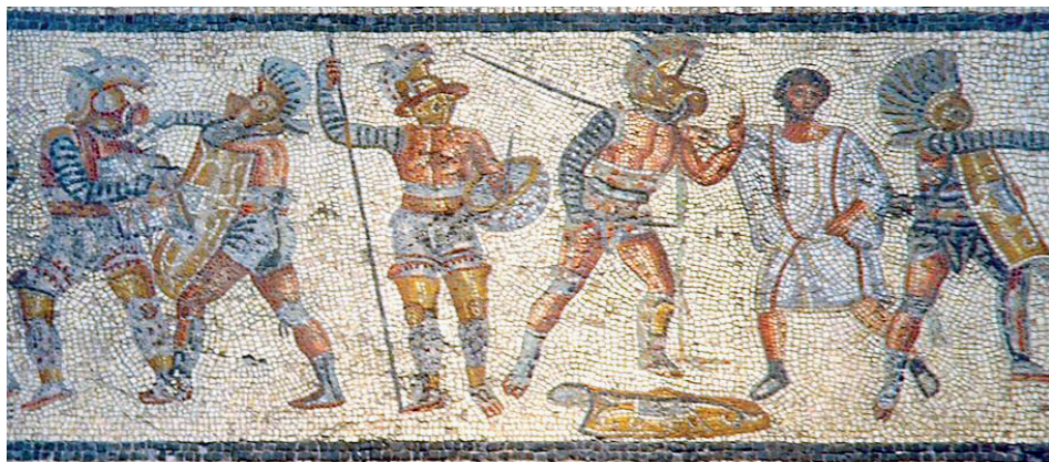
Slika 4. Prizori gladijatora iz mozaika „Villa Dar Buc Ammera“, Arheološki muzej u Tripoliju, Libija

razne tehnološko-vojne uređaje, a popularnost će se prenijeti na sve stanovnike, čak i na careve.