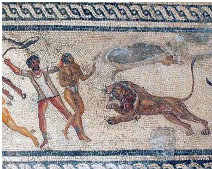
Slika 10. Prizori bestiariusa u borbi s mozaika „Villa Dar Buc Ammera“, Arheološki muzej u Tripoliju, Libija

log tomu idu i nalazi diljem Europe. U Efezu (Turska), kazalište, samo nekih 900 m jugozapadno od gladijatorskog groblja, sadrži nalaze koji pokazuju prisutnost gladijatora, a isti procesi se mogu prepoznati i kod kazališta u Ateni, Aphrodisiasu, Assosu i Hierapolisu. 25