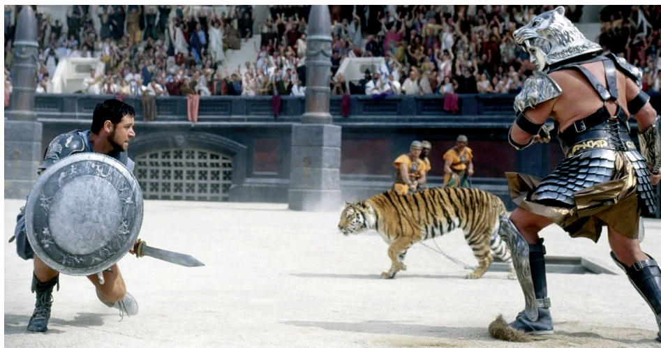
Slika 14. Isječak iz filma Gladijator, redatelja Ridleyja Scotta

mom gladijatora, kao što su antičke vaze i svjetiljke od terakote. Očuvani mozaici iz ovog rada dolaze iz područja današnje Libije, Austrije i Švicarske, a vjerno prikazuju gladijatore u akciji. Čak nismo ni ušli u dubinu najvećih, najgrandioznijih građevinskih uspjeha – amfiteatara – koji samo pokazuju koliko je bilo zanimanje za ovakav oblik zabave.