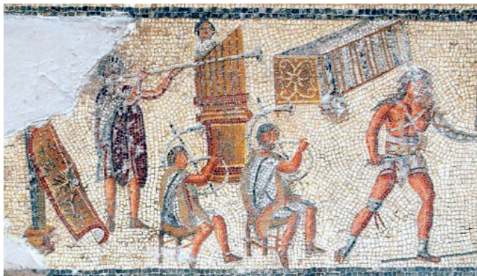
Slika 11. Prizori gladijatora s mozaika „Villa Dar Buc Ammera“, Arheološki muzej u Tripoliju, Libija

će u gradovima postati glavnim mjestima zabave. S vremenom, ovakav oblik zabave i građevine proširit će se diljem Rimskog carstva, od Sredozemlja do britanskog otočja.