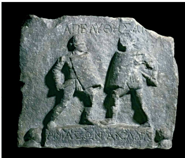
Slika 6. Mramorna ploča s prikazom dviju gladijatorica, Britanski muzej

gladijatori, ali bez šljemova. Rijetki su nalazi kao navedeni koji govore o ženskim pripadnicama ovog okrutnog športa, ali je poznato kako je rimski car Septimije Sever 200. godine zabranio gladijatorice. 16