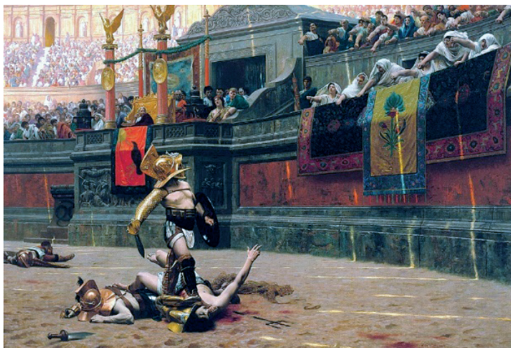
Slika 13. Jean-Léon Gérôme, „Okrenuti palac“ ( Pollice Verso ), Muzej umjetnosti u Phoenixu

zlatnih, a potom i plavih boja, produbljuje se profinjenost ovog djela. Gledateljstvo pokazuje palac dolje, što bi značilo smrt za palog gladijatora. Nadalje, u dvadesetom stoljeću, izaći će dva romana na temu Spartakova ustanka, James Leslie Mitchell 1930. te Howard Fast 1951., dodatno produživši opčinjenost gladijatorima. Ista će tema potom 1960. osvanuti u umjetničkom kinematografskom ruhu, pod palicom Stanleyja Kubricka. Početkom novog tisućljeć, još jedan umjetničko - kinematografski događaj obilježit će temu gladijatora, s jednostavnim nazivom filma Gladijator , ali vrlo jakim među gledateljstvom.