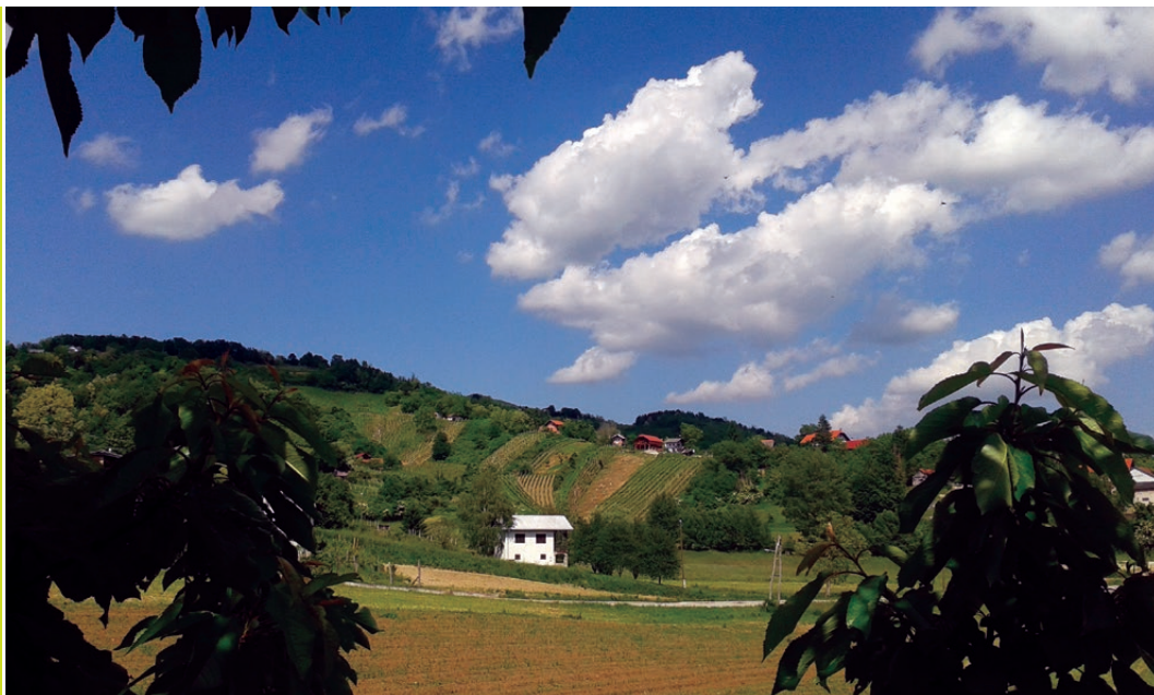
Sl. 1. Karakteristični kulturni pejzaž Krapinsko-zagorske županije

grafske slike i fizičko-geografskih faktora nisu razvile ostale više dohodovne djelatnosti.