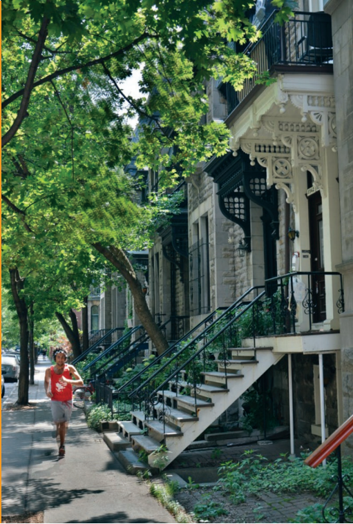
Sl. 3. Tipične niske stambene zgrade kuće sa stepenicama u središtu Montreala

Svaka provincija Kanade ima na automobilskim registarskim oznakama neki slogan. Quebec koristi svoj službeni moto Je me souviens ( Sjećam se ), a automobili imaju tablice samo na stražnjoj strani. Automobili provincije Ontario, primjerice, imaju na tablicama Yours to discover ( Vama na otkrivanje ).