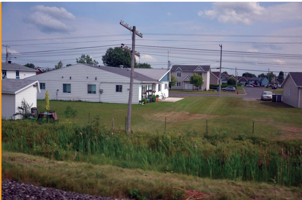
Sl. 4. S puta Montreal – Quebec gledamo tipični kanadski krajolik: kuće su niske, okućnice velike, a svaka obitelj ima automobil

Središtem dominira slika dvorca Frontenac, koji se u gotovo svim jezicima naziva na francuski način: Château Frontenac . Turist će pomisliti da se radi o dvorcu iz kojega se nekad upravljalo gradom i okolicom, ali nije tako. Kad čuje da je to hotel, onda se može zgroziti dosezima neoliberalnog kapitalizma , međutim ovo je zdanje i izgrađeno kao hotel - 1924. izgrađen je središnji toranj, a arhitekt je bio William Sutherland Maxwell, kao jedan u nizu hotela na Kanadskoj tihooceanskoj željeznici ( Canadian Pacific Railway company ). Njime i sličnim hotelima u Kanadi upravlja poduzeće Fairmont Hotels and Resorts, sa sjedištem u Torontu. Ubraja se u povijesne lokalitete Kanade (National Historic Sites of Canada).