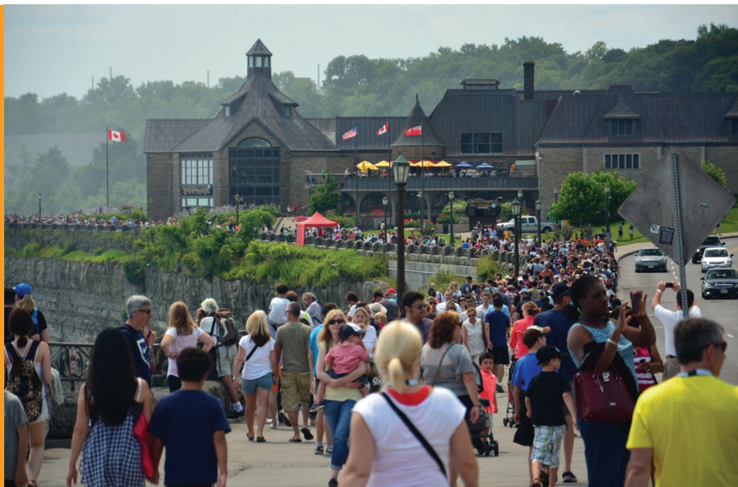
Sl. 8. Nijagarine slapove posjećuje oko 12 000 000 turista godišnje

turizmu. Aranžman iz Toronta često obuhvaća i posjet vinariji jer u ovom dijelu Kanade ima i vinogradarstva.