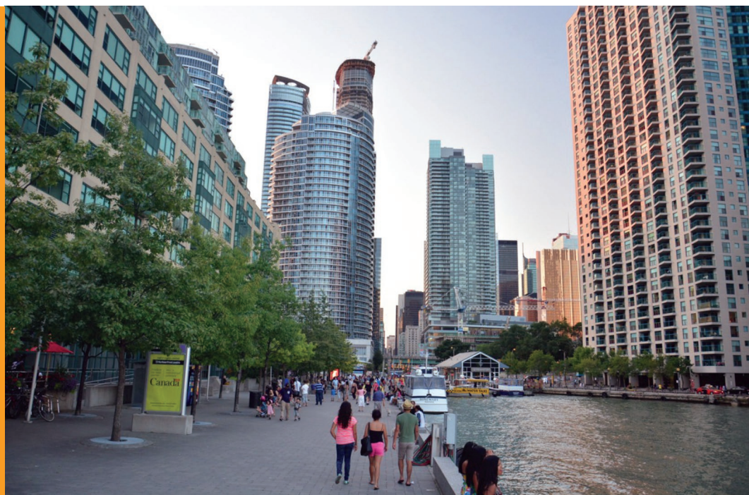
Sl. 6. Waterfront u Torontu od neprivlačne lučko-industrijske zone postao je privlačna stambeno-zabavna zona grada

ga se ovdje naziva Streetcar . Jedan trg slovi za središnji – Yonge-Dundas, nazvan tako samo po ulicama među kojima se nalazi. Zaprepasti vas broj i veličina ekrana za elektronske reklame na njegovim zgradama. Čovjek koji kaže da je doselio prije 40-tak godina iz Trinidada i Tobaga u veseljačkom latinskoameričkom stilu ovdje kaže: „Mi primamo useljenike i izbjeglice iz cijeloga svijeta da dođu i žive ovdje. Da dođu i žive ovdje! Pogledaj ove ljude – tko je tu Kanađanin? Svi smo mi Kanađani!“ I u drugim prilikama može se saznati da velik broj stanovnika Toronta voli njegovu multinacionalnost. Istražujući, saznajemo da je Toronto među najšarolikijim gradovima svijeta što se tiče narodnosti, jezika i vjeroispovijedi koje u njemu žive. Popis stanovništva Kanade 2011. navodi ovo etničko porijeklo stanovništva Toronta: englesko (12,9 %), kinesko (12,0 %), kanadsko