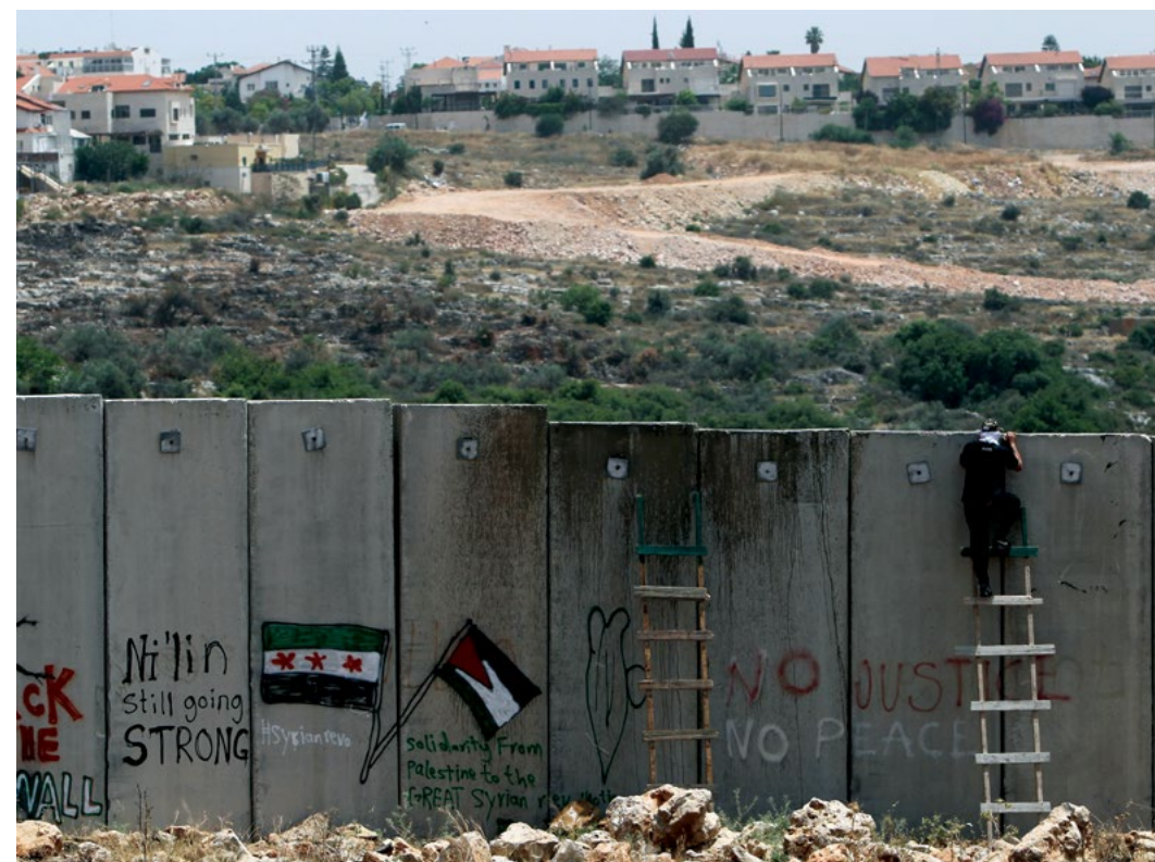
Sl. 2. Izraelska sigurnosna barijera uz Zapadnu obalu*