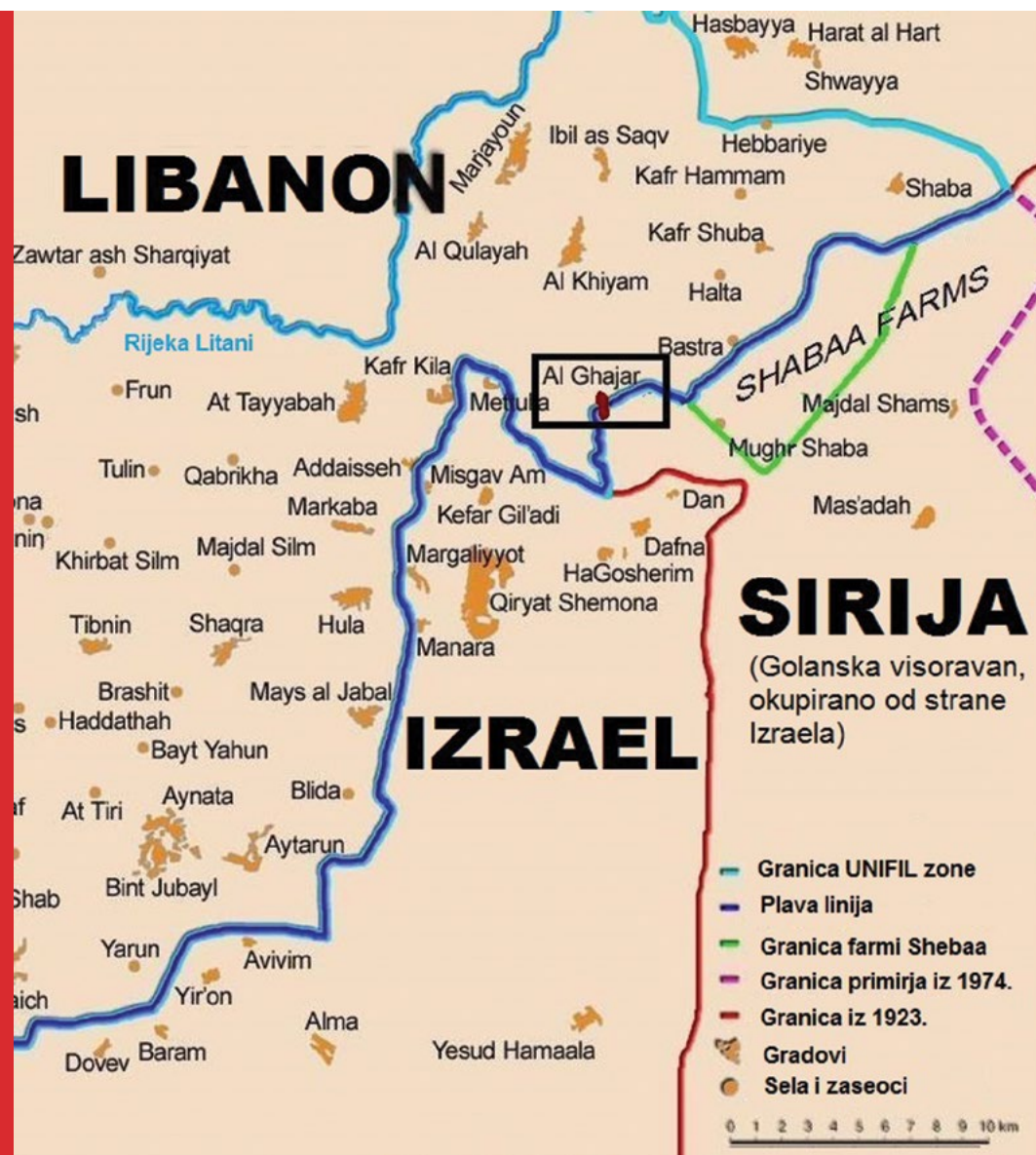
Sl. 3. Granica na Golanskoj visoravni*

*Potenciran sirijskim bombardiranjem Izrael je 1967. uzvatio napad na Golansku visoravan i zauzeo manji grad neznatnog strateškog značaja Ghajar, koji nadgleda izvor Wazani i čini najvažniji prinos vode rijeci Hasbani tijekom sušnih razdoblja. Hasbani je pritok Jordana i u jednom dijelu nalazi se na udaljenosti od 8 km od rijeke Litani. Pojedina istraživanja pretpostavljaju povezanost tokova Hasbani i Litani podzemnim sustavima temeljem godišnjeg protoka i izračunatih nedostataka. Litani je važan izvor vode u Libanonu kojeg su cionisti svojatali tijekom britanskog mandata i koji je bio predmet optužbi upućenih Izraelu zbog pretpostavljenih pretenzija na libanonske vodne resursa te pokušaje krađe vode iz Litania (Medzini i Wolf, 2004).