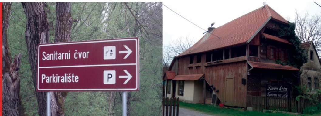
Sl. 2. Smeđa turistička signalizacija i obnovljeni čardak u selu Čigoč

žilovčica, Lonja). Najintenzivniji proces koji se trenutno zbiva je obnova i prenamjena starih drvenih kuća (čardaka) koji su proglašeni dijelom kulturne baštine u funkciju turizma (info centri, smještaj, ugostiteljstvo, suvenirnice). Zbog demografskih i socijalnih faktora koji djeluju kao izrazito limitirajući nije došlo do masovne prenamjene i revitalizacije, za sada se radi o pojedinačnim slučajevima, ali koji su svakim danom sve brojniji.