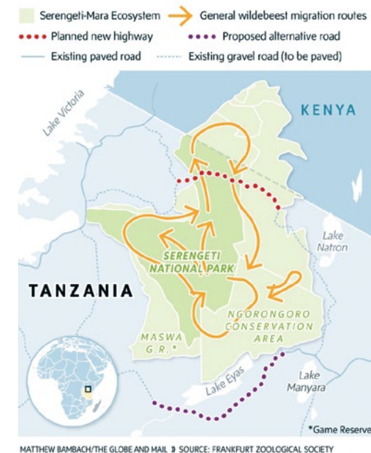
Sl. 4. Plan izgradnje autoceste kroz nacionalni park Serengeti

Krivolov, sječa i iskorištavanje tih resursa. Većina prirodnih spomenika u Africi su u izvjesnoj mjeri pogođeni nezakonitim lovom i drugim oblicima upotrebe resursa. Veliki sisavci koji su ciljani za vrijedne trofeje, kao što su nosorog i slon posebno su ranjiva