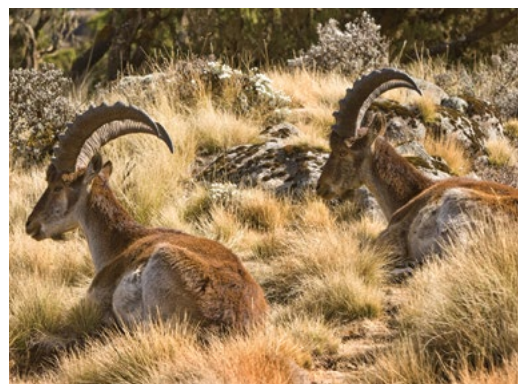
Sl. 9. Walla kozorog – ugroženi endem u nacionalnom parku Simien u Etiopiji