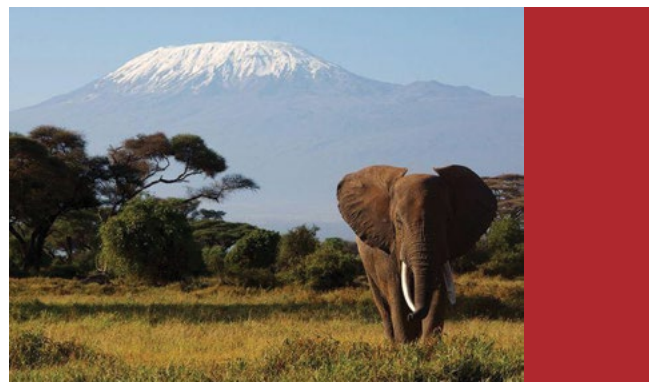
Sl. 2. Nacionalni park Kilimanjaro

prirodnih spomenika baštine, 33 kulturna spomenika baštine te 4 mješovita (tab. 1). Iako ih nema mnogo, ti spomenici baštine predstavljaju neka od najspektakularnijih prirodnih mjesta na Zemlji, kao i najdragocjeniju kulturnu baštinu koja obuhvaća cjelokupnu ljudsku povijest iz vremena naših predaka do danas. Prirodna baština poput nacionalnog parka Serengeti, Viktorijinih vodopada, Kilimanjara i Ngorongoro kratera, te kulturna poput velikih egipatskih piramida, Abu Simbela i drevne Tebe, samo