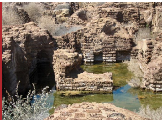
Sl. 8. Porast razine vode u Abu Meni u Egiptu

Abu Mena (Egipat) je dodan na Popis baštine u opasnosti 2001. jer je kao i mnoge druge drevne strukture počeo patiti zbog slijeganja povezanog s rastućom vodom zbog novog navodnjavanja i razvoja poljoprivrede u tom području. Napori se ulažu da bi se stanje popravilo poboljšavanjem dre-