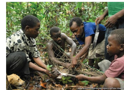
Sl. 7. Krivolov u nacionalnom parku u Srednjoafričkoj Republici

Nacionalni park Manovo-Gounda St. Floris (Srednjoafrička Republika) dodan je