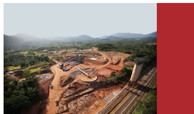
Sl. 3. Eksploatacija željezne rude na planini Nimba u Liberiji

Politički i građanski nemiri. Djelovanja pobunjeničkih skupina za vrijeme učestalih nemira i oružanih sukoba najviše štete spomeničkoj baštini prostora Afrike.