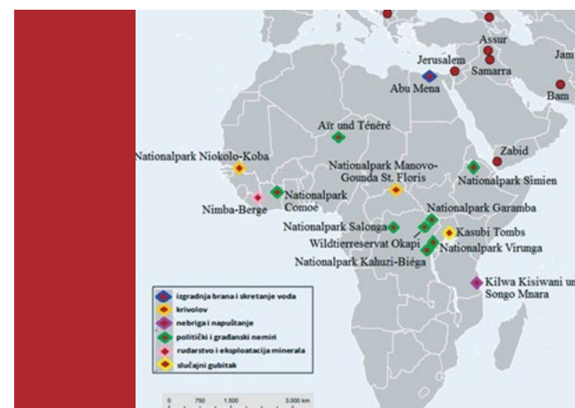
Sl. 10. UNESCO-ovi spomenici baštine u opasnosti u Africi 2012. godine

naže i podupiranjem pogođenih zgrada, ali učinkovito dugoročno rješenje još nije postignuto (Howard, 2012).