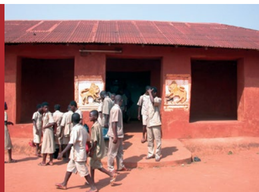
Sl. 5. Pripreme za ritualne običaje u palačama Abomey u Beninu

Klimatske promjene. Dugoročni utjecaj klimatskih promjena je teško procijeniti, ali