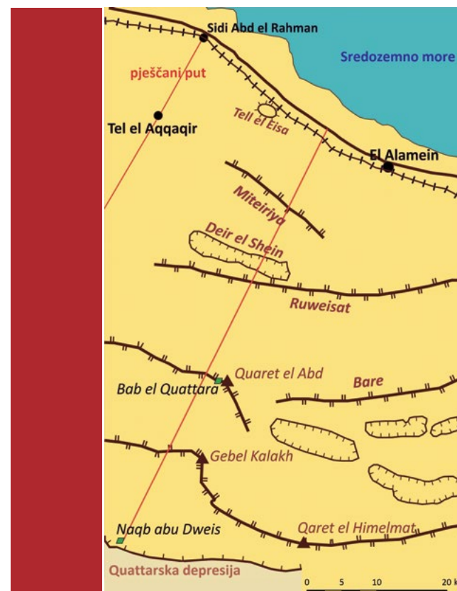
Sl. 2. Fizički i socijalni elementi bojišta kod El Alameina

Vode. Pustinjski okoliš općenito oskudijeva vodom, a tamo gdje je i malo ima često je zaslanjena. Slane močvare javljaju se i u