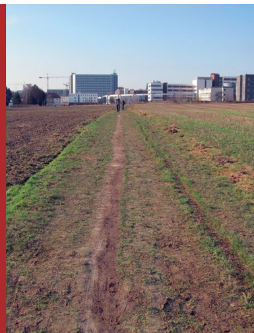
Sl. 2. Dio kampusa Tehničkog sveučilišta u Dortmundu (Technische Universität Dortmund). Visokoškolske institucije u Ruhru osnivane su u 1960-ima; u zimskom semestru 2010/2011 na pet ruhrskih sveučilišta, 14 veleučilišta i jednoj likovnoj akademiji studiralo je 196.489 studenata (RVR, 2012).

Snažan i često nekontroliran proces industrijalizacije tijekom 19. i 20. stoljeća za posljedicu je imao radikalnu preobrazbu prostora. U Ruhru se danas isprepleću gradske četvrti s industrijskim postrojenjima, gustom cestovnom i željezničkom mrežom, ali i šumskim, poljoprivrednim i vodenim površinama. Kod kategorija korištenja zemljišta na području Ruhra 2012.