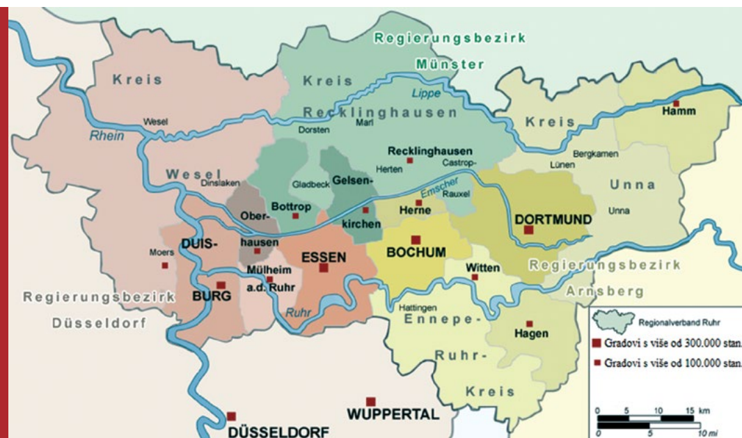
Sl. 1. Gradovi i okruzi u ruhrskom regionalnom udruženju ( Regionalverband Ruhr )

skog razvoja. Za razliku od monocentričnih gradskih regija u Njemačkoj, poput Berlina, Hamburga i Münchena, Ruhr je gradska regija s više jezgara, koja se razvijala na temelju rudarstva i metalurgije (Vresk, 1990). Sastoji se od gradova koji su se za vrijeme industrijalizacije razvijali neovisno jedan o drugome te više ili manje međusobno srasli. Prijelazi među gradovima obično su predgrađa, ali i neizgrađena područja te poljoprivredne površine. U središnjem pojasu gradova takvi prijelazi teže su raspoznatljivi. Ruhr se danas ubraja među najveće gradske regije Europe, a zajedno s Düsseldorfom, Kölnom, Bonnomo i drugim gradovima u četverokutu Hamm – Wesel – Mönchengladbach – Bonn unutar njemačke savezne zemlje Nordrhein-Westfalen (NRW) čini i veliku konurbaciju Rajna-Ruhr s oko 10 milijuna stanovnika. S više od jedne pe-