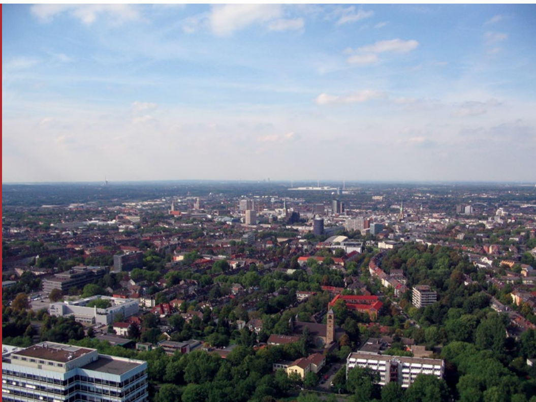
Sl. 8. „Zeleni“ Dortmund – više od polovice površine najvećeg ruhrskog grada čine zelene površine. Nekada najpoznatiji kao grad čelika, ugljena i brojnih pivovara danas gradi novi identitet i sve više se oslanja na visoku tehnologiju.

primjerice, pejzažni park Duisburg-Nord, unutrašnju luku u Duisburgu, gazometar u Oberhausenu, njemački muzej rudarstva u Bochumu, metalurško postrojenje Henrichshütte Hattingen i dr. Istaknuti spomenik