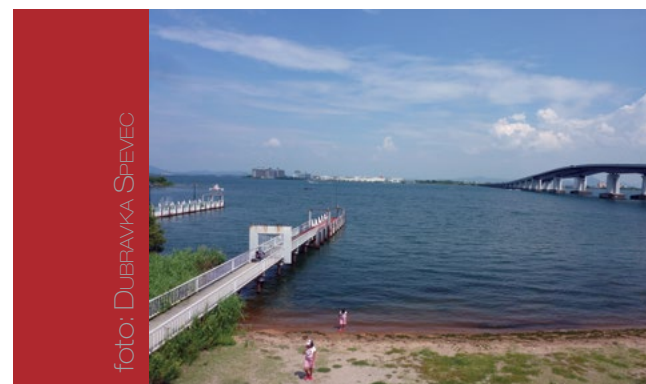
Sl. 6. Jezero Biwa – najveće slatkovodno jezero u Japanu