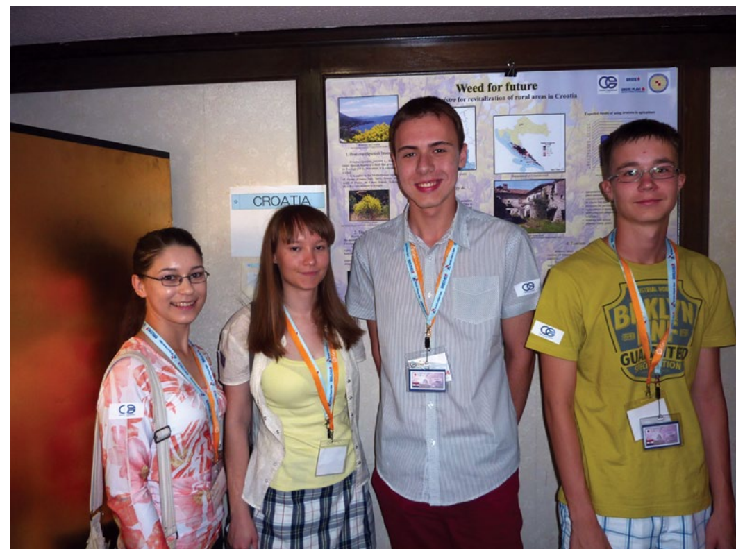
Sl. 5. Prezentacija postera hrvatskog tima

Kako bi se sve sudionike olimpijade upoznao sa znamenitostima i načinom života zemlje domaćina, organizatori su pripremili cjelodnevni izlet u okolici Kyota (sl. 6), a nekoliko