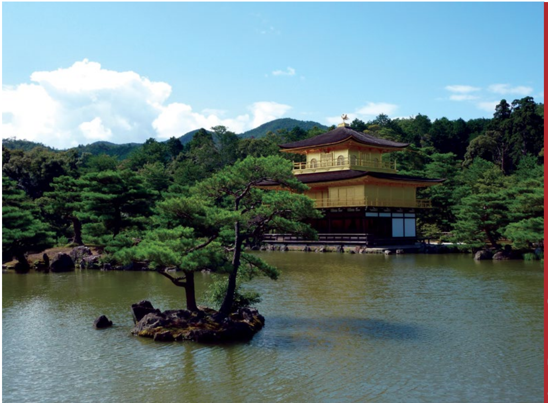
Sl. 1. Zlatni paviljon u Kyotu – gradu domaćinu 10. svjetske geografske olimpijade

Jubilarna 10. svjetska geografska olimpijada održana je od 30. srpnja do 5. kolovoza 2013. u japanskom gradu Kyotu (sl. 1). Svjetske geografske olimpijade, na kojima sudjeluju učenici srednjih škola u dobi od 16 do 19 godina, održavaju se pod pokroviteljskom Međunarodne geografske unije (IGU) još od 1996., kada je održana prva svjetska olimpijada u Den Haagu, Nizozemska. Sve do 2012. održavale su se svake dvije godine, a od tada održavaju se svake godine. Osnovni ciljevi svjetskih geografskih olimpijada su poticati zanimanje mladih ljudi za geografska istraživanja, razvijati njihova geografska znanja i vještine, doprinjeti razvoju svijesti o važnosti geografije kao predmeta u školama, ali i poticati socijalni kontakt među natjecateljima kao i međusobno uvažavanje različitih naroda i kultura. Službeni jezik svjetske geografske olimpijade je engleski.