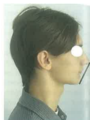
Slika 9. Klasa II/2 - konveksan profil uz karakterističnu promi-nenciju nosa i vertikalno povećanje srednje trećine lica.

Slike 1 – 9 Ljubaznošću prof. dr. sc. Mladena Šlaja