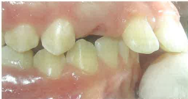
Slika 2. Klasa II/1 - izražena incizalna stepenica i protruzija frontalnih zubi.