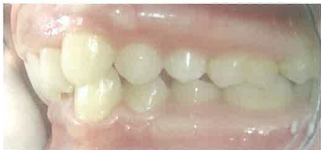
Slika 3. Klasa II/2 - retrudirani gornji frontalni zubi i duboki zagriz.