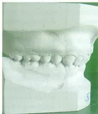
Slika 8a. Klasa II/2 - prikaz na modelu.