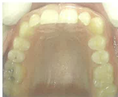
Slika 7. Klasa II/2 - gornji zubni luk, prisutna široka apikalna baza.