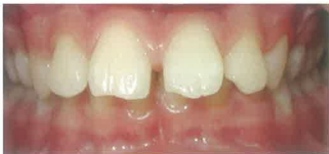
Slika 4. Klasa II/1 - protruzija gornjih frontalnih zubi uz prisutnost dijastema i izraženom incizalnom stepenicom.