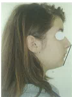
Slika 6. Klasa II/1 - dominira konveksan profil lica.