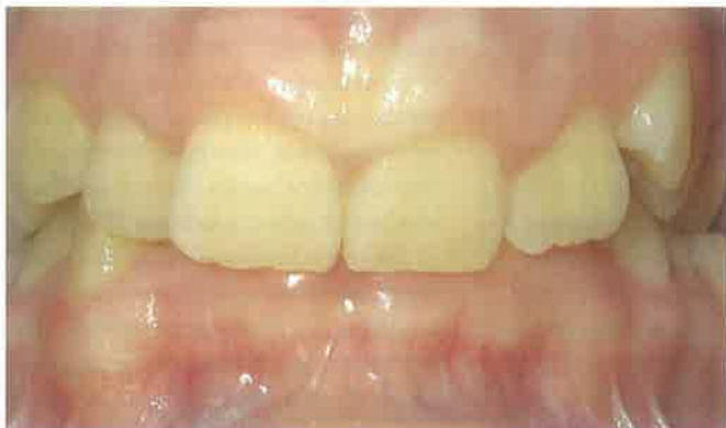
Slika 8. Klasa II/2 - retroinklinacija gornjih frontalnih zubi, uz stupanj kompresije.