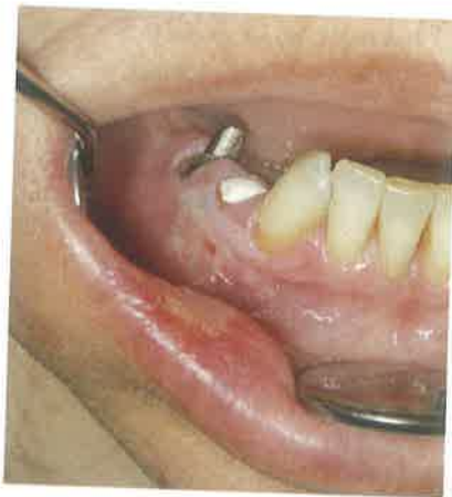
Slika 1. Oštećenje sluznice hipokloritom.