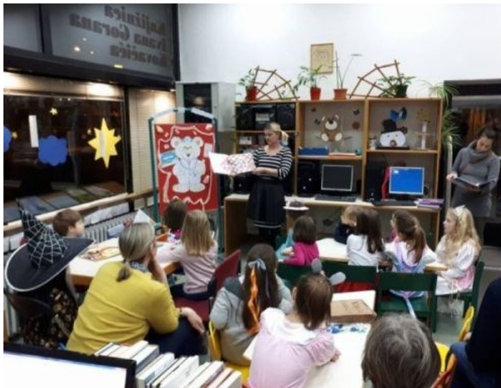
Slika 1. Kreativni svijet priča

raspravljaju o samoj temi, imaju prijedloge o drukčijem završetku priče, komentiraju ilustracije... – tu je posebno naglasak na jezičnom izražavanju.