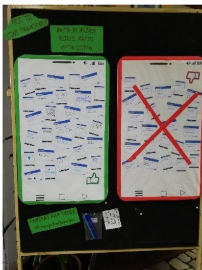
Slika 1. #samojednalijepariječ može učiniti promjenu