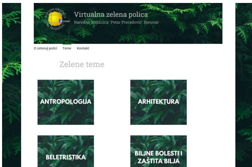
Slika 1. Početna stranica Virtualne zelene police s popisom obuhvaćenih tematskih kategorija

Na početnoj stranici pod nazivom Teme navedene su sve kategorije stručnih i znanstvenih knjiga. Tamo korisnici mogu pronaći zelenu literaturu iz područja antropologije, arhitekture, zaštite bilja, botanike, etike i sl. Odabirom pojedinog područja korisnik je preusmjeren do popisa pripadajućih zelenih knjiga. Klikom na određenu knjigu korisnicima se otkrivaju detaljnije informacije o samoj knjizi (naslov knjige, autor, naslovnica knjige, kratak opis i kategorija). Poveznica ispod naslovne slike usmjerit će posjetitelje stranice na mrežni katalog gdje mogu provjeriti dostupnost i lokaciju knjige u fizičkom prostoru Knjižnice. Ako korisnici žele provjeriti dostupnost knjige ili je rezervirati, to mogu učiniti mobilnom aplikacijom mKnjižnica.