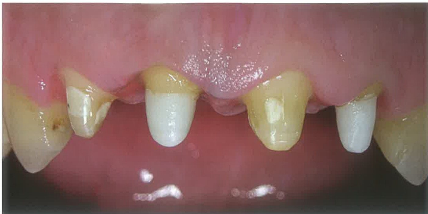
Slika 5. Cementirane cirkonijeve nadogradnje 11 i 22

lagodne obliku i duljini korijenskog kanala svakog pojedinog zuba za koji se izrađuju. Takve nadogradnje cementiraju se u korijenski kanal i ako su pravilno izrađene gotovo je nemoguće njihovo kasnije uklanjanje i revizija punjenja korijenskog kanala. Uglavnom su vrlo rigidne (neelastične) te tvore monoblok sa zubom s vrlo malom količinom spojnog međumaterijala (cementa). Vertikalne sile uglavnom su dobro distribuirane i najjače se oko vrha individualne nadogradnje. Ekscentrične lateralne sile prenose uglavnom preko vrha nadogradnje (princip poluge) no ukoliko je nadogradnja dovoljne duljine te sile su uglavnom malene [1].