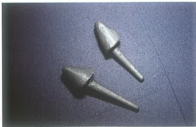
Slika 1. Lijevane individualne nadogradnje

Najčešće se sastoje od kolčića koji je korijenski dio i jezgre koja je koronarni dio. Jezgra se izrađuje direktno u ustima, a može biti kompozitna, stakleno iono-