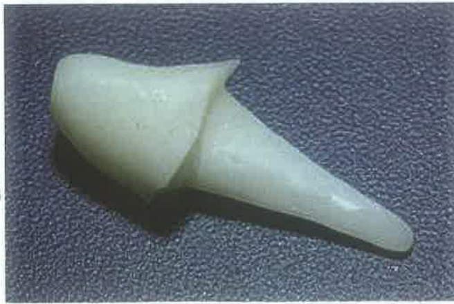
Slika 2. Cirkonska nadogradnja