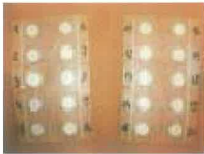
Slika 1. Epikutani test na leđima koji se provodi radi dokazivanja kontaktne alergije na različite materijale (preuzeto sa www.lgl.bayern.de/.../umweltmedizin/nickel.htm )

Kontaktne alergijske reakcije na oralnoj sluznici mogu se, osim na stomatološke materijale, pojaviti i nakon primjene kozmetičkih sredstava, oralnih antiseptika i dr. (11,12). Povećan broj alergijskih reakcija na stomatološke materijale i lijekove uvjetovan je pronalascima novih sintetičkih materijala i slitina, koje se rabe u oralnoj rehabilitaciji (10). Također je važno navesti povezanost nekih alergijskih reakcija pa su tako dokazane međusobne križne alergijske reakcije na nikal, paladij i zlato. Tako su epikutanim testom ispitani zdravi ispitanici na kontaktne alergijske reakcije na zlato, nikal i paladij te je utvrđeno da je u patch testu polovica pozitivnih na zlato bila pozitivna na nikal, a polovica alergič-