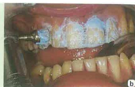
Slika 5a-b: a- PMTC- uklanjanje zubnog plaka ultrazvučnim instrumentima; b- poliranje zuba pastom nakon uklanjanja plaka.

Zato se danas uz fluoride za remineralizaciju i prevenciju karijesa koriste derivati kazeina. Kazeinfosfopeptid (engl: caseinphosphopeptide (CPP)) je bioaktivni peptid koji se stvara tijekom digestije peptida. CPP ima sposobnost vezivanja kalcija tj. ima sposobnost stabilizacije kalcij fosfata u otopini kao amorfnu kalcij fosfat (ACP). Amorfnu kalcij fosfat osigurava fosfatne i kalcijeve ione koji su potrebni za remineralizaciju cakline (slika 6a-c). CPP-ACP (Recaldent™) se može primjenjivati u žvakaćim gumama, otopinama za ispiranje ili topikalnim kremama kao što je Tooth Mousse. Preparati kao MI Plus Pasta u svom sastavu uz CPP-ACP imaju i fluoridne ione. Kontraindikacija za primjenu CPP-ACP je preosjetljivost na derivate mlijeka. Važno je napomenuti da se Tooth Mousse pasta može primjenjivati kod male djece, trudnica, a u klinici prije i poslije izbjeljivanja zuba. CPP-ACP je vrlo ljepljiv te će se lijepiti na površinu zuba, ali i na plak, te okolnu sluznicu i tako biti stalni rezervoar kalcija i fosfata koji se otpuštaju samo u kiselom mediju. MI Plus pasta, koja sadrži i fluoride, se ne primjenjuje kod