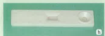
Slika 4a-h: a- test za određivanje razine S. mutans ; b- u posudicu sa sakupljenom stimuliranom slinom doda se 1 kap reagensa 1; c- sadržaj plastične posudice se dobro promiješa; d- zatim se dodaju 4 kapi reagensa 2; e- sadržaj posudice se opet dobro promiješa; f- plastičnom pipetom se uzima uzorak iz posudice; g- uzorak se postavlja u bunarić; h- nakon 15 minuta se očita rezultat testa koji je u ovom slučaju negativan ( <5 \cdot 10^5 CFU/ml sline), jer se roza crta pojavila samo pod oznakom C (control) unutar prozorčića.