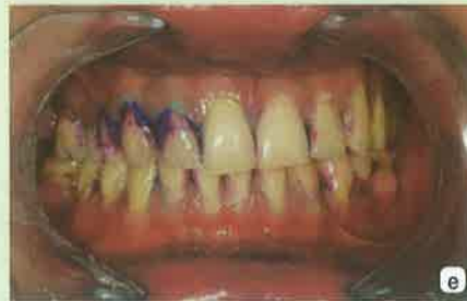
Slika 3a-e: a- Plaque indicator kit- za testiranje plaka; b- otopina C se kistićem nanese na sve zube; c- nakon što su svi zubi premazani, pacijent ispere usta vodom; d- rezultat plak testa u fronti; e- rezultat plak testa u lateralnom segmentu, vidljiv je svježi (rozo) i zreli (plavo/ ljubičasto) plak.