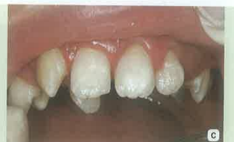
Slika 6a-c: a- bijele mrlje na gornjim središnjim sjekutićima; b- primjena MI Plus paste za remineralizaciju; c- izgled bijele mrlje nakon 3 mjeseca.