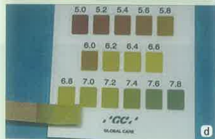
Slika 1a-d: a- Saliva-Check- za testiranje slina; b- papirići za određivanje pH vrijednosti slina; c- papirić se kratko uroni u posudicu sa sakupljenom stimuliranom ili nestimuliranom slinom; d- nakon 5 minuta se očita pH vrijednost slina.