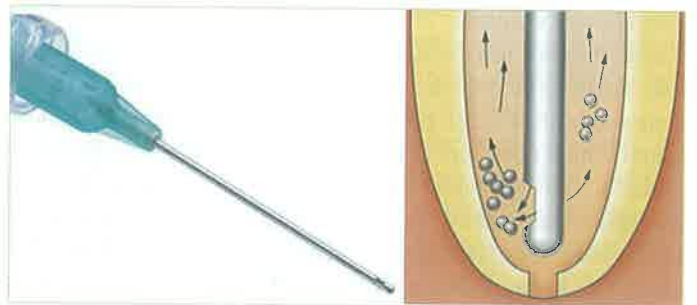
Slika 7. Endodontska igla za ispiranje korijenskih kanala (preuzeto iz PDQ ENDODONTICS John I, Ingle)

i 2,5% NaOCl, također se gledao učinak djelovanja nakon 5, 10 i 15 minuta. Rezultati su pokazali da 15% EDTA ima najbolje rezultate prilikom uklanjanja kalcijevih iona i to u sva tri vremenska perioda, 15% limunska kiselina pokazala je slične rezultate dok su 5% fosforna kiselina i 2,5% NaOCl pokazali znatno slabije rezultate te djelovanje samo u prvih pet minuta.