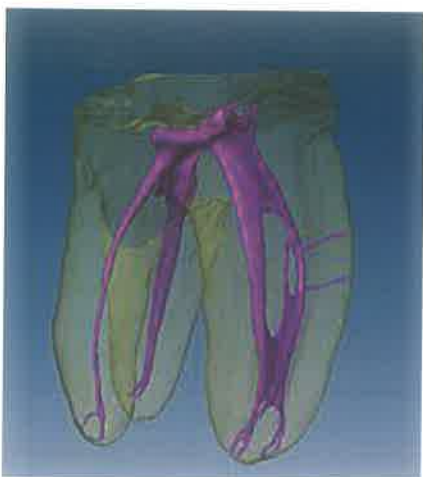
Slika 1. Morfologija korijenskog kanala

Mehaničkom instrumentacijom uklanja se većina nekrotičnog tkiva zajedno s bakterijskim kolonijama iz glavnog kanala i iz dentinskih tubulusa prilikom proširenja i oblikovanja korijenskog kanala. No, morfologija endodontskog prostora (multipli otvori, furkacije, zavoji, lateralni i akcesorni kanalići) (slika 1), polinfekcija i rezistentnost mikroorganizama uzrok je tome da endodontski instrumenti (čelični, NiTi) ne mogu sami po sebi biti djelotvorni pa je potrebna dodatna kemijska obrada kao potpora mehaničkoj. Ispiranje korijenskih kanala tako prati kompletnu instrumentaciju.