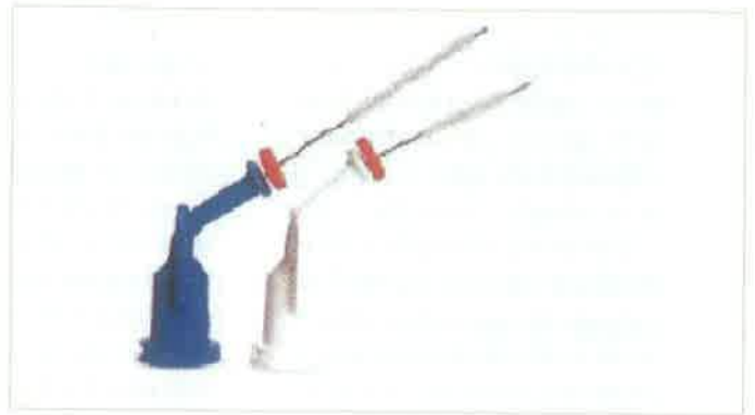
Slika 6. Endodontska igla za ispiranje korijenskih kanala sa dodatnim vlaknima za bolje čišćenje