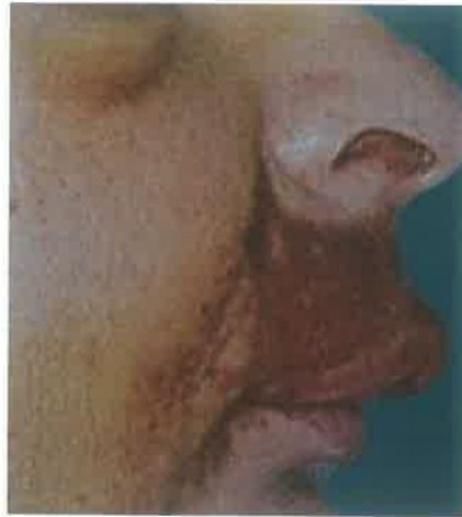
Slika 2. Emfizem uzrokovan nepažljivom upotrebom H_2O_2