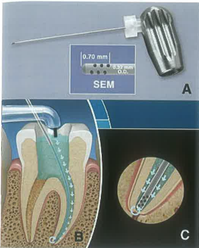
Slika 5. a) Endodontska igla za ispiranje korijenskih kanala sa 12 malih rupica položenih radialno u završnih 0,7 mm igle - rupice sprječavaju začepljenje igle tijekom aspiracije b) i c) sredstvo za ispiranje je aplicirano u razini trepanacijskog otvora, a endodontska igla na apeksu stvara usisni efekt aspirirajući sadržaj