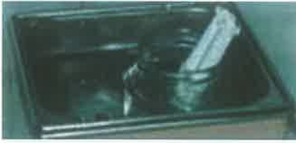
Slika 3. NaOCl se u kupki grije na 60°C. Temperatura se održava na istoj vrijednosti.

permeabilnost pa tako H 2 O 2 lakše penetri- ra te djeluje na unutarstanične elemente. Kliničke studije djelotvornosti CHX na floru inficiranih korijenskih kanala po- kazale su visok stupanj redukcije mikro- ba čak i pri jako malim koncentracijama. Zamany i sur (6) dodali su 2% CHX kon- vencionalnoj terapiji, 7 od 12 kontrolnih slučajeva u kojima se nije koristio CHX imalo je ostatke rezidualnih mikroor- ganizama. CHX ima dobar antimikrobn- ni učinak na kandidu pa se često koristi nakon konvencionalne upotrebe NaOCl kako bi inhibirao eventualnu inicijalnu adherenciju i daljnju akumulaciju gljiva i drugih mikroorganizama. Djelovanje mu je jače ako je prethodno uklonjen zaostat- ni sloj na kojeg ne djeluje. CHX (pozitivno nabijeni ioni) se veže na dentin i djeluje kroz duži vremenski period (svojstvo su- stantivnosti). Muhammadi i sur. (9) su došli do zaključka da substantivnost ovisi o koncentraciji, pa tako da bi se povećao broj slobodnih molekula CHX koja ulaze