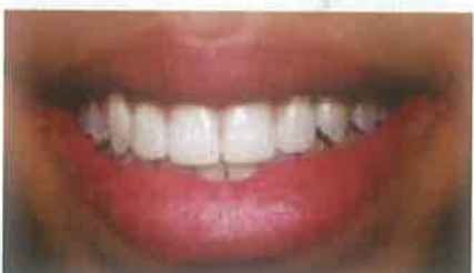
Slike 10. i 11. Promjena cjelokupnog dojma primjenom samo dviju ljuskica na lateralnim sjekutićima.