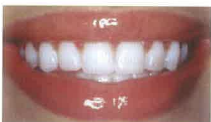
Slike 8. i 9. Prekrivanje caklinskih defekata te promjena oblika zubi.