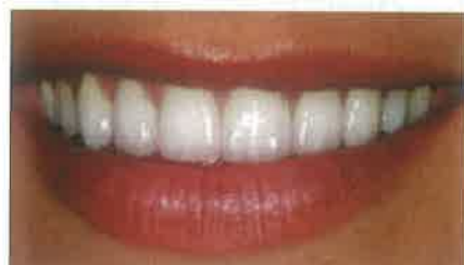
Slike 4. i 5. Zatvaranje središnje dijasteme te preoblikovanje cijelog zubnog niza kao i posvjetljenje boje pomoću ljuskica.