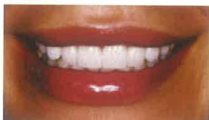
Slike 6. i 7. Prekrivanje caklinskih defekata te produljenje kruna.