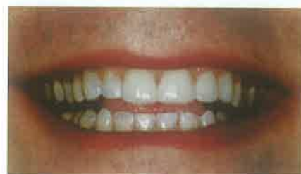
Slike 2. i 3. Zatvaranje dijastema ljuskicama.