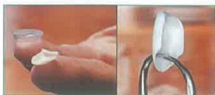
Slika 1. „non-prep“ ljuskica