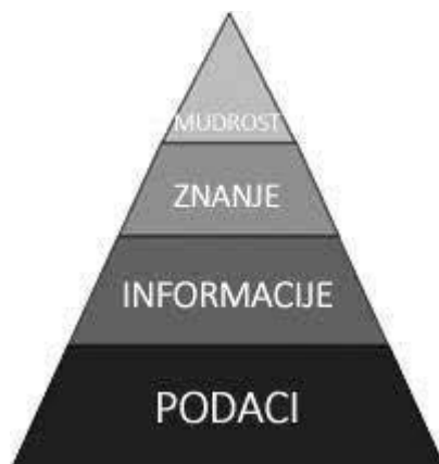
Slika 1. DIKW - hijerarhija u obliku piramide.

Oblik piramide najčešći je oblik u kojem DIKW – hijerarhiju nalazimo u literaturi. Piramida na samom dnu ima sloj podataka, iznad kojeg se nalazi sloj informacija, a koji je manji od sloja podataka. Zatim, iznad sloja informacija, imamo manji sloj znanja te na vrhu piramide sloj mudrost kao najmanji sloj (Slika 1).