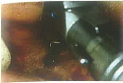
Slika 4. Čeličnim svrdlom se prodre kroz kost do lumena šupljine

pristup mjestu lezije te uklanjanje patološkog tkiva, moguće poticanje rasta kosti biološkim usadcima i bio membranama.