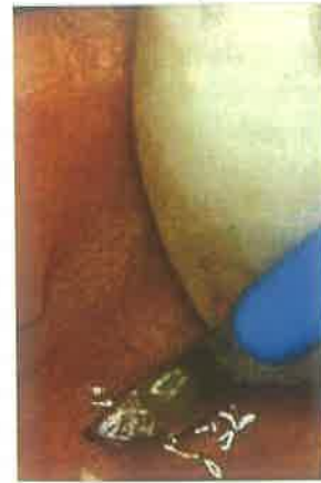
Slika 3. Rezanje sluznice skalpelom