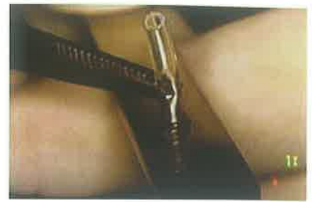
Slika 6. Izrada proširenja na cjevčici koje sprječava upadanje cjevčice u lumen šupljine