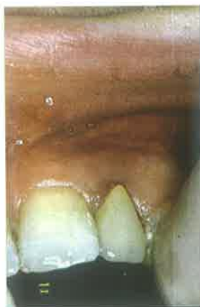
Slika 1. Izgled vestibularne sluznice iznad zuba 22

Ono što je jedinstveno u terapiji upala endodontskog porijekla je da terapiju započinjemo liječenjem endodontskog prostora ili uklanjanjem zuba. To, naravno, ovisi o budućem planu rehabilitacije žvačnog sustava. Uz endodontsko liječenje, po potrebi paralelno ili nakon nekog vremena se provode i zahvati endodontske kirurgije. Standardni koraci su dizajn režnja, fizički