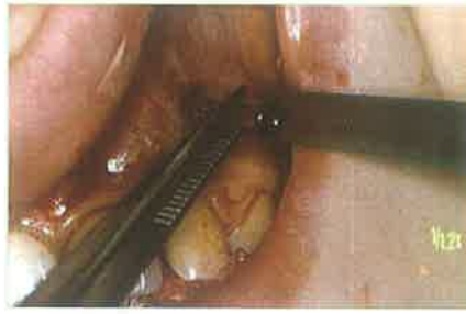
Slika 5. Umetanje pripremljene polietilenske cjevčice malog promjera

calis acc., a pretpostavljali smo da se radi o cisti. Smatrali smo da bi kirurški pristup u ovom stanju bio preradikalalan i da bi morali izvaditi zub, a moguć je i poremećaj cirkulacije na susjednom središnjem incizivu kao posljedica kirurškog pristupa. Odlučili smo se prvo napraviti reviziju punjenja te provesti dekompresiju kroz pet tjedana te pratiti zub najmanje godinu ili dvije. Nakon provedene endodontske terapije, anestezirali smo područje te skalpelom načinili mali rez na vestibularnoj sluznici iznad patološke promjene (slika 3). Dekompresija podrazumijeva prodor kroz sluznicu i kost do lumena šupljine (slika 4) najčešće sterilnim okruglim svrdlom uz obilno vođeno hlađenje, a potom se kroz nastali kanal umeće polietilenska cjevčica koja djelomično viri u lumen usne šupljine (slika 5). Prodor se može izvesti u cijelosti svrdlom, ali samo na pričvrstnoj gingivi. U području slobodne gingive, rotirajuće svrdlo može „namotati“ i tako oštetiti sluznicu. Iako se na virećem dijelu cjevčice, prije umetanja napravi proširenje u obliku trubice (najbolje zagrijanim ravnim instrumentom) (slika 6), dobro je jednim šavom pričvrstiti cjevčicu za okolno meko tkivo (slika 7). Sterilnom iglom i špricom se fiziološkom otopinom dobro ispere šupljina više puta dnevno (slika 8). Pacijenti ispiranje vrše sami ili im pomaže netko