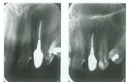
Slike 9 i 10. Kontrolne rgtg snimke nakon godine i dvije godine