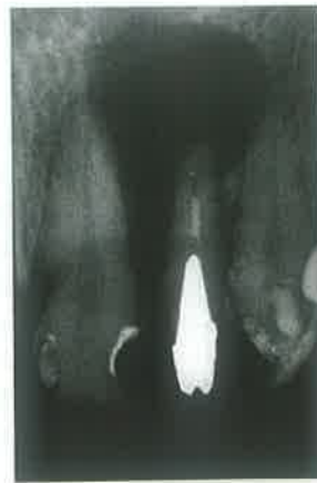
Slika 2. Nedovoljno punjen korijenski kanal u kojem se nalazi lijevana nadogradnja. Vidi se periradikularni nestanak kosti