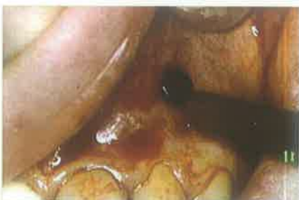
Slika 8. Ispiranje šupljine fiziološkom otopinom pomoću igle i šprice

calis acc., a pretpostavljali smo da se radi o cisti. Smatrali smo da bi kirurški pristup u ovom stanju bio preradikalalan i da bi morali izvaditi zub, a moguć je i poremećaj cirkulacije na susjednom središnjem incizivu kao posljedica kirurškog pristupa. Odlučili smo se prvo napraviti reviziju punjenja te provesti dekompresiju kroz pet tjedana te pratiti zub najmanje godinu ili dvije. Nakon provedene endodontske terapije, anestezirali smo područje te skalpelom načinili mali rez na vestibularnoj sluznici iznad patološke promjene (slika 3). Dekompresija podrazumijeva prodor kroz sluznicu i kost do lumena šupljine (slika 4) najčešće sterilnim okruglim svrdlom uz obilno vođeno hlađenje, a potom se kroz nastali kanal umeće polietilenska cjevčica koja djelomično viri u lumen usne šupljine (slika 5). Prodor se može izvesti u cijelosti svrdlom, ali samo na pričvrstnoj gingivi. U području slobodne gingive, rotirajuće svrdlo može „namotati“ i tako oštetiti sluznicu. Iako se na virećem dijelu cjevčice, prije umetanja napravi proširenje u obliku trubice (najbolje zagrijanim ravnim instrumentom) (slika 6), dobro je jednim šavom pričvrstiti cjevčicu za okolno meko tkivo (slika 7). Sterilnom iglom i špricom se fiziološkom otopinom dobro ispere šupljina više puta dnevno (slika 8). Pacijenti ispiranje vrše sami ili im pomaže netko