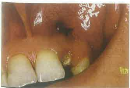
Slika 7. Cjevčica dodatno učvršćena šavom

Pacijentica se javila u ambulantu zbog bolova na zubu 22. Kliničkim pregledom nije se vidjela promjena na vestibularnoj sluznici (slika 1), ali je na pritisak područje bolno. Zub je bio bolan na perkusiju. Na rgtg snimci se vidjelo loše endodontsko punjenje korijena zuba 22, lijevana nadogradnja i krunica. Periradikularno se vidio veliki koštani defekt uz gubitak lamine dure na mezijalnoj strani korijena (slika 2) Postavljena je radna dijagnoza: parodontitis api-