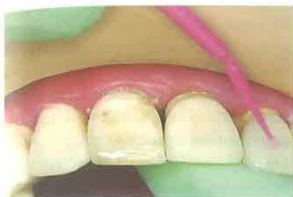
Slika 4. Nanošenje adheziva i polimerizacija