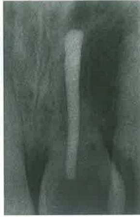
Slika 9. Ankilozna resorpcija

količine mješavine MTA i vode uvode se u kanal i lagano kondenziraju nabijačem sa stoperom. Blago prepunjenje kanala ne predstavlja opasnost. Apikalni čep MTA cementa mora biti deo barem 4 mm. Ostatak kanala može se napuniti klasičnim metodama (gutaperka) nakon 4 sata koliko je potrebno MTA cementu da se stvrdne (4).