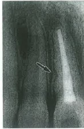
Slika 8. Infekcijska resorpcija