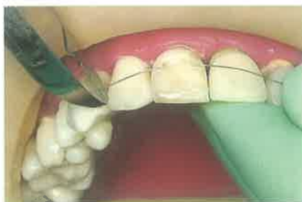
Slika 1. Određivanje duljine žice i rezanje kliještima

Kako bi započeli ispravnu terapiju avulzije, potrebno je znati je li završen rast i