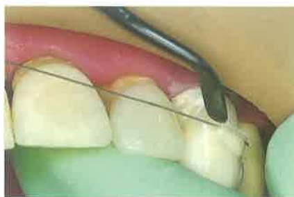
Slika 5. Nanošenje kompozita na najdistalniji zub u splintu i postavljanje žice; polimeriziranje