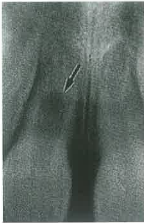
Slika 7. Interna resorpcija nakon replantacije zuba