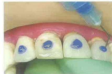
Slika 3. Jetkanje labijalnih površina zuba. Nakon jetkanja, kiselina se ispiri, a zubi suše