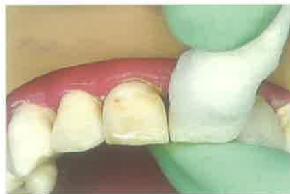
Slika 2. Čišćenje labijalnih ploha zuba koje želimo povezati splintom svitkom staničevine namočenim u otopinu natrijevog hipoklorita