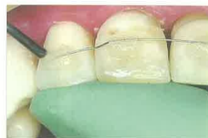
Slika 6. Postupak ponavljamo za svaki zub u splintu

razvoj korijena izbijenog zuba, koliko je vremena zub proveo izvan alveole te radi li se o mliječnom ili trajnom zubu.