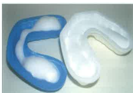
Slika 4. Žlice za fluoridaciju gelom