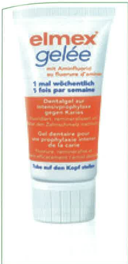
Slika 6. Gel za fluoridaciju