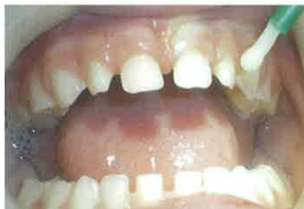
Slika 2. Aplikacija fluoridnog laka