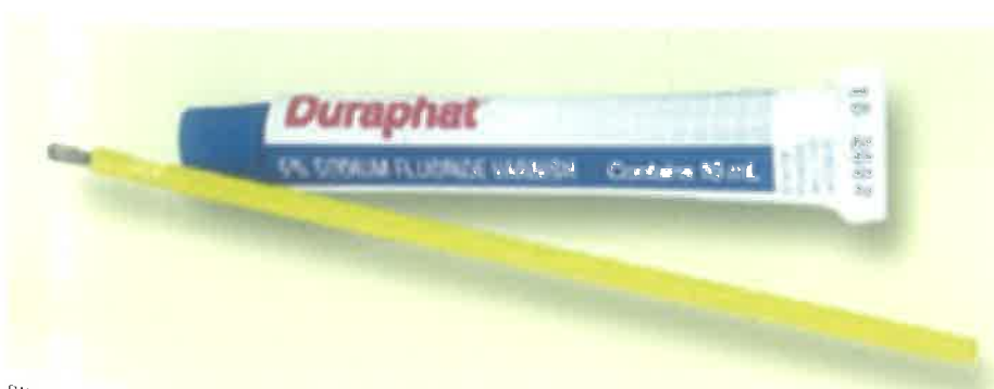
Slika 5. Fluoridni lak Duraphat