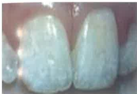
Slika 1. Dentalna fluorozna