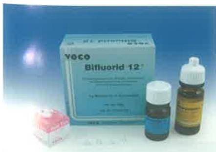
Slika 3. Fluoridni lak Bifluorid 12