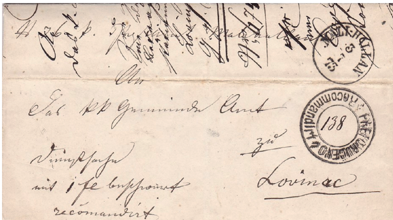
Slika 4. Zatvoreno pismo iz 1873.