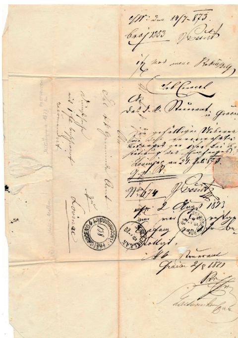
Slika 5. Vanjska strana pisma iz 1873.