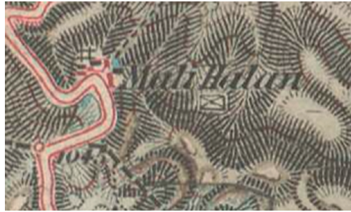
Slika 1. Prikaz naselja Mali Halan na topografskoj karti Austro-Ugarske

organizirana u područja pod inženjeringom 17 pukovnija. U Gospiću se nalazilo sjedište 1. pukovnije nazvane Lička krajiška pješačka pukovnija. U njenom sastavu bila je 8. Lovinačka satnija ( kumpanija ) koja je obuhvaćala naselja Cerje, Kik, Lovinac, Ploče, Ričice, Smokrić, Sveti Rok i Vranik. Najstarija pošta s područja Lovinca bila je vojna pošta u današnjem Ličkom Cerju (tada