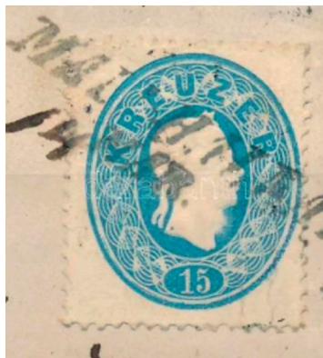
Slika 3. Isječak pisma sa žigom pošte Mali Halan iz 1860. – 1861. Privatno vlasništvo 6

O postojanju pošte na Malom Halanu svjedoči i sačuvan stariji vrlo rijedak primjer vodornog žiga pošte Mali Halan ( tekst na žigu: Mali Hallan ) iz 1860./1861. koji je sačuvan na isječku pisma (slika 3). Sigurni smo kako je pismo žigosano 14. ožujka, ali kako tadašnji žigovi nisu bilježili godinu, razdoblje od dvije godine je pretpostavljeno prema periodu uporabe ove marke i tadašnjem iznosu poštarine. Marka od 15 krajcara je u to doba bila poštarina za pismo koje se šalje na ciljno odredište udaljenosti veće od 20 poštanskih milja (tj. više od 150 km) pa je takvo pismo vjerojatno poslano na neko udalje-