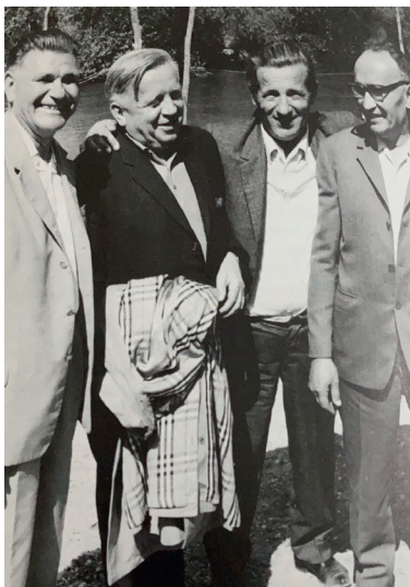
Čopić u Lici (izvor: Čengić, 1987.)

u Lici stekla zagledača i prosioca da nadaleko nije izišla na glas kao 'sok', neka vrsta hajdučkog povjerenika, preko koga su opljačkani seljaci s hajducima hvatali vezu i dogovarali se o ucjeni“ (Čopić 1983: 61).