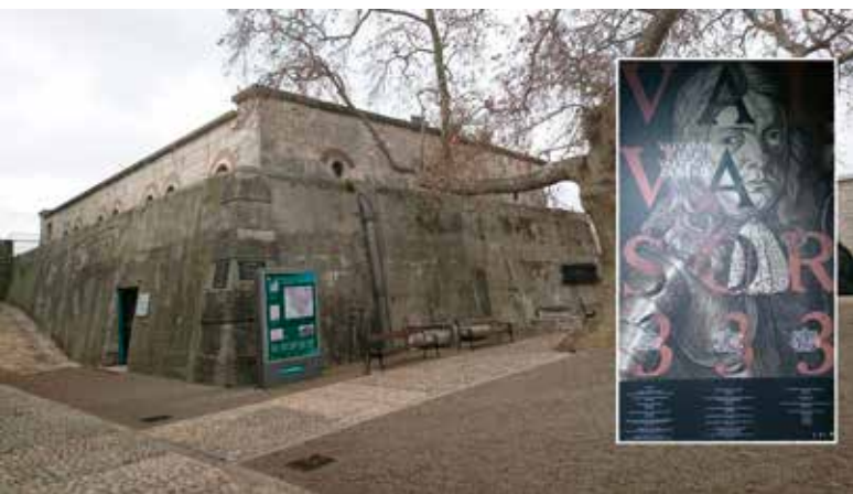
Slika 1: Izložba je organizirana u prostoru nekadašnje vodospreme na Kaštelu

Međutim, u to doba nije bilo ni financijskih ni tehničkih mogućnosti za izdavanje tako opsežne enciklopedije. U Kranjskoj nije bilo tiskare koja bi ju mogla tiskati. Stoga je Valvasor osnovao grafičku radionicu i bakroreznu tiskaru u svom dvorcu i sam tiskao knjigu. Knjiga je tiskana 1689. godine. Na njemačkom je jeziku i ima ukupno 3532 stranice, 24 priloga i 528 bakroreza. Objavljeno je stotinjak primjeraka. Sve to ga je toliko osiromašilo da je, nedugo nakon tiskanja, morao rasprodati gotovo cijelu svoju imovinu. Zagrebački biskup A. I. Mikulić je 1690. godine od njega kupio knjižnicu s 10 000 svezaka i grafičku zbirku te tako utemeljio Metropolitansku knjižnicu. Valvasor se vratio u Krško, gdje je četiri godine kasnije umro. Imao je samo 52 godine.