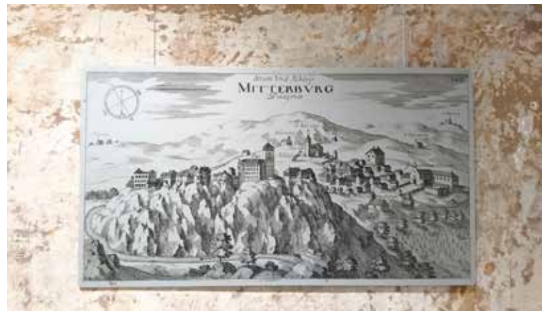
Slika 4: Jedna od grafika s izložbe, grafika Pazina

U središtu izložbe je Istra viđena očima Valvasora. Dizajner izložbe, Matija Ferlin, osmislio je izuzetno zanimljiv postav, tako da posjetitelj 'ulazi' u knjigu, a čita samo one dijelove koji su mu zanimljivi. Na samom ulazu nalaze se tri ostakljene vitrine, u kojima su izvorni, tiskani primjerci triju tomova Slave vojvodine Kranjske , s popratnim objašnjenjima i granicama Vojvodine Kranjske. Po zidovima su raspoređene uvećane grafike gradova Pazinske knežije i Kastavske gospoštije, s odabranim isječcima iz teksta karakterističnim za mjesto