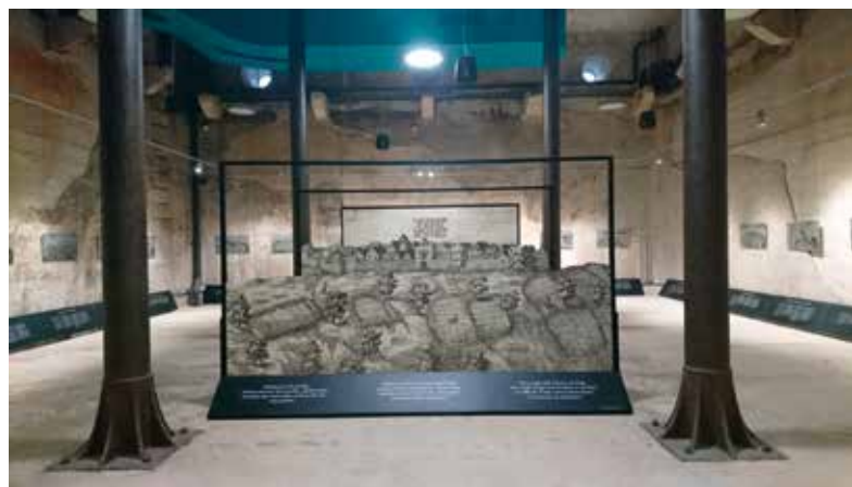
Slika 2: Unutrašnjost s postavom, u središtu pogled na Tinjan