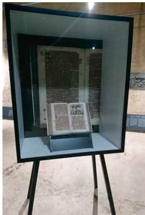
Slika 6: Vitrina s jednim od tomova Slave vojvodine Kranjske