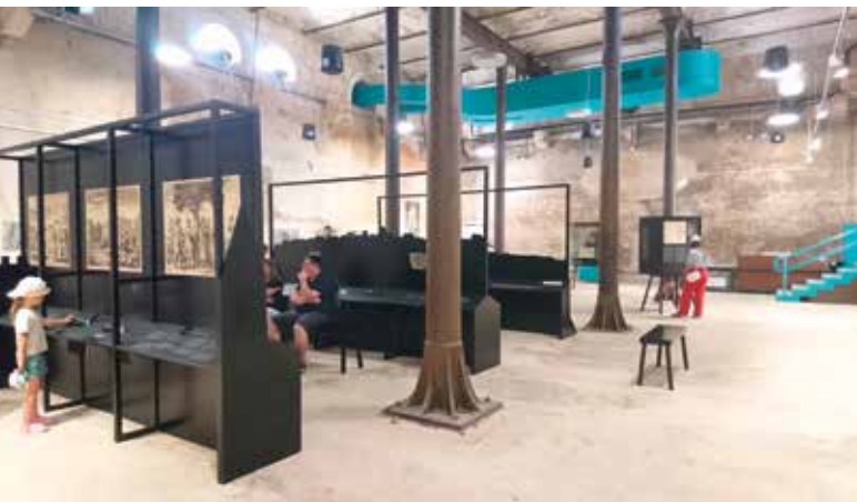
Slika 3: Džepovi s dodatnim informacijama

Njemu u čast ovom izložbom se obilježavaju 333 godine od tiskanja te onodobne enciklopedije.