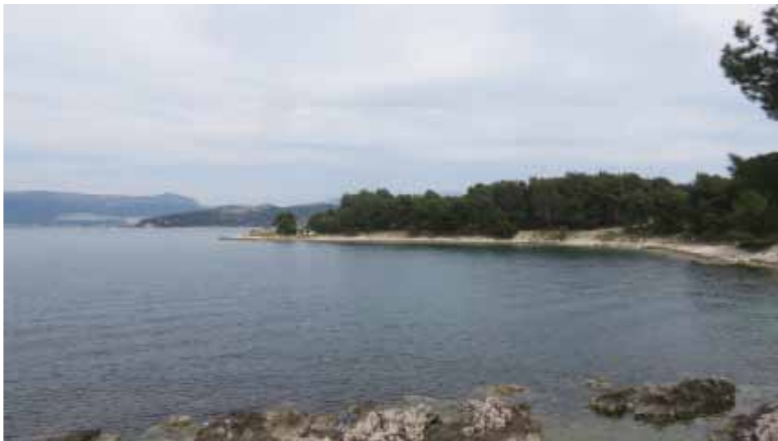
Sl. 3. Poluotok Supetar u Slatinama, položaj crkve sv. Petra, pogled sa zapada / Fig. 3. Supetar peninsula in Slatine, position of the church of St Peter, view from west

O crkvi sv. Mavra u Žednom već sam pisao u više navrata, a i ovdje sam upozorio na neodrživost hipoteze o njezinom starokršćanskom, ali i o predromaničkom porijeklu, 39 koja se provlači kroz literaturu zbog nalaza predromaničke skulpture u njoj. Tako Tomislav Marasović, iako prihvaća moje mišljenje da nije ustanovljen njezin ranosrednjovjekovni sloj, napominje da na njega "upućuju ulomci predromaničkog kamenog namještaja". 40 I Dunja Babić iznosi tezu o sakralnom kontinuitetu na položaju Sv. Mavra od kasne antike nadalje, ali ne spominje predromaničku crkvu. 41 Stoga crkvu sv. Mavra i lokalitet na kojemu se nalazi treba ubuduće isključiti iz rasprava o predromaničkim crkvama na Čiovu.