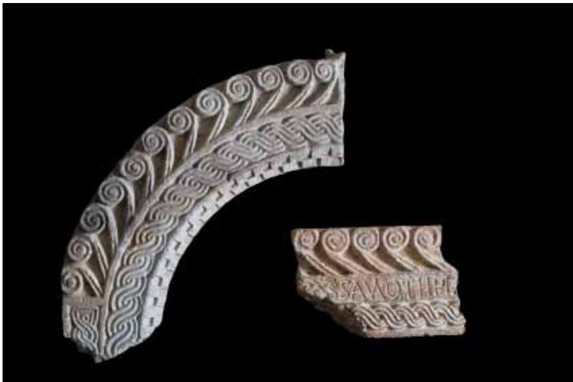
Sl. 1. Predromanički ulomci trabeacije oltarne ograde Sv. Vitala iz Divulja (9. st.) otkriveni u Sv. Mavru u Žednom / Fig. 1. Pre-Romanesque fragments of the chancel screen trabeation of St Vitalis from Divulje (9 th c.) found in St Maurus in Žedno

ali koji se uglavnom odnose na romaničku i kasnije epohe, pa ćemo se ovdje ograničiti samo na dio koji se tiče predromanike i starijih stilskih razdoblja. Za plutej ugrađen kao oltarna menza u Sv. Andriji kaže da je iz neke predromaničke crkve i iznosi pretpostavku da je porijeklom iz Sv. Marte u Bijaćima. Pri tome se poziva na mišljenje Ive Babića, koji je samo usporedio stil i kompoziciju na pluteju iz Sv. Andrije s onima iz Sv. Marte, a inače zastupa mišljenje da je plutej dio starije oltarne ograde iz Sv. Andrije. 29