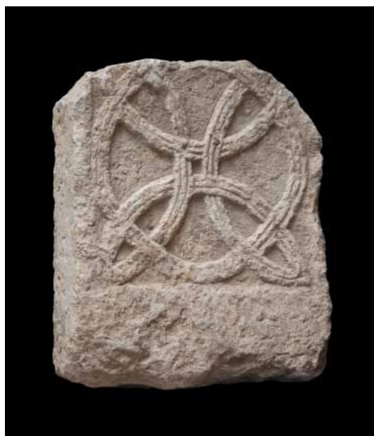
Sl. 4. Predromanički plutej iz Sv. Petra u Slatinama, 9. st. (Muzej hrvatskih arheoloških spomenika, inv. br. 2255) / Fig. 4. Pre-Romanesque chancel screen panel from St Peter in Slatine, 9 th c. (Museum of Croatian Archaeological Monuments, Inv. no. 2255)