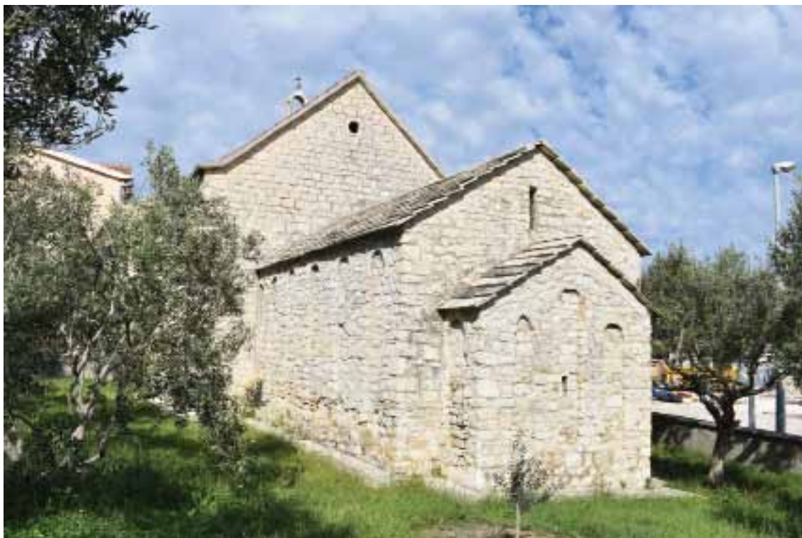
Sl. 6. Predromanička crkva Gospe pokraj mora, 11. st. / Fig. 6. Pre-Romanesque church of Our Lady by the Sea, 11 th c.

Uvjetno se kao o predromaničkoj može govoriti o crkvi sv. Andrije, posebice ako se priklonimo jednoj od ponuđenih kronoloških odrednica za najstariju fazu crkve koju nudi Tomislav Marasović, a to je 7. ili 8. st., iako je i on, kao i ostali autori koji su pisali o tome, skloniji datiranju u 6. ili 7. st. 45 Tu, pak, moram odmah naglasiti da i dalje ostajem pri mišljenju da plutej iz baroknog oltara Sv. Andrije, za koji su svi suglasni da je iz 6. ili 7. st., nije nikada pripadao izvornoj opremi te crkve, već je tu dospio kao spolia iz neke gradske crkve u Trogiru. 46 S tog aspekta gledajući moguća datacija u 7. ili 8. st. i dalje ostaje u kombinaciji do daljnjih istraživanja i analiza.