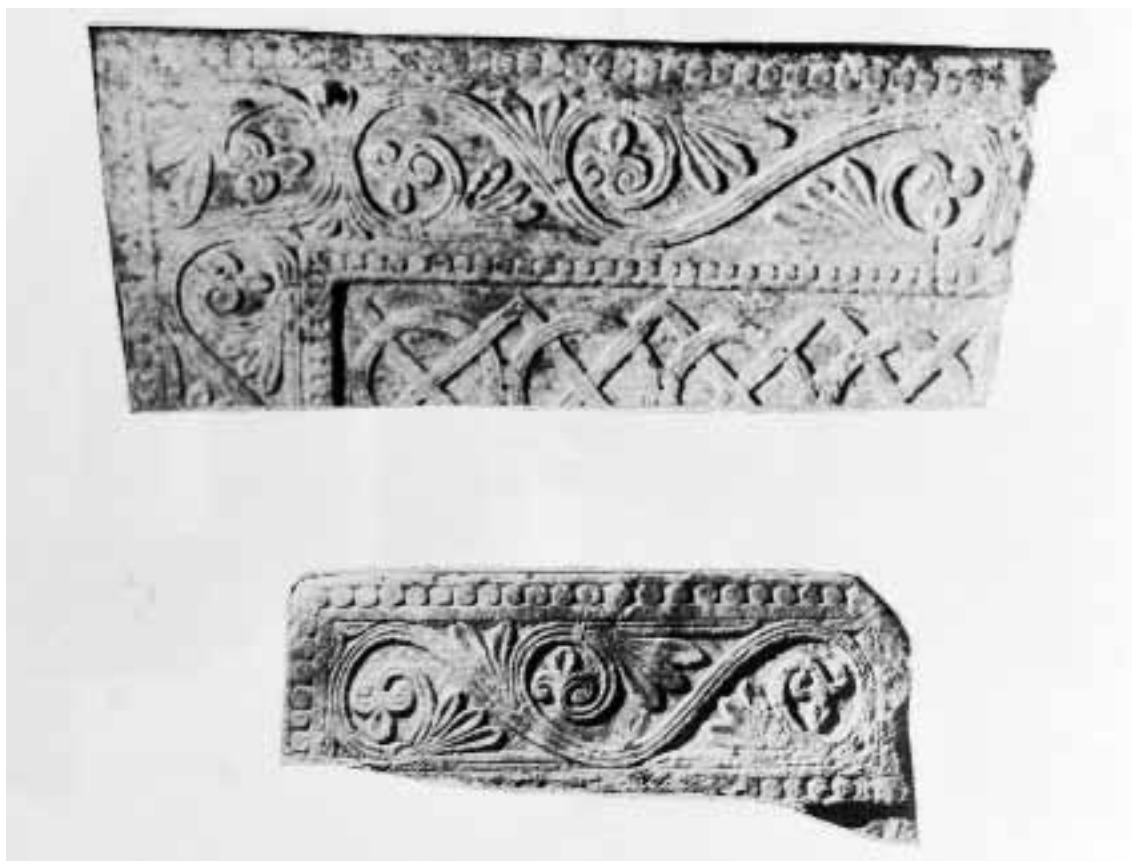
Sl. 5. Pluteji iz nepoznate trogirske crkve (11. st.) nađeni u baroknom oltaru Sv. Teodora u Gornjem Okrugu / Fig. 5. Chancel screen panels from an unknown church in Trogir (11 th c.) found in the Baroque altar of St Theodore in Gornji Okrug