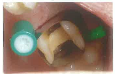
Slika 3. Postavljena matrica prije cementiranja