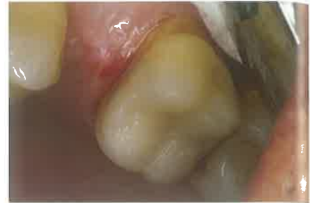
Slika 6. Polirana indirektna restauracija

Indirektne kompozitne restauracije se cementiraju kompozitnim cementom (dvostruko polimerizirajući) u boji zuba odnosno restauracije. Korištenje oscilirajuće tehnike cementiranja (eng. ultrasonic insertion technique) s posebnim nastavkom za cementiranje restauracija/krunica dovodi do povećanja tiksotropnosti kompozitnog cementa i bolje sveze materijala i zubnog tkiva (slika 4). Zatim slijedi polimerizacija i odstranjivanje matrice, te dodatna po-