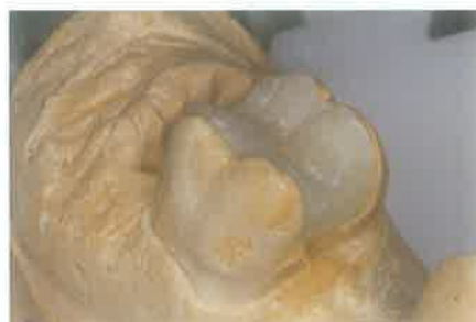
Slika 2. Indirektna restauracija na gipsanom odljevu