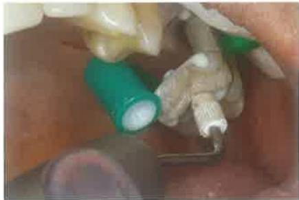
Slika 4. Cementiranje indirektna restauracije