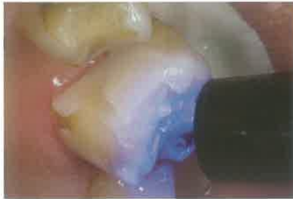
Slika 5. Polimerizacija kompozitnog cementa