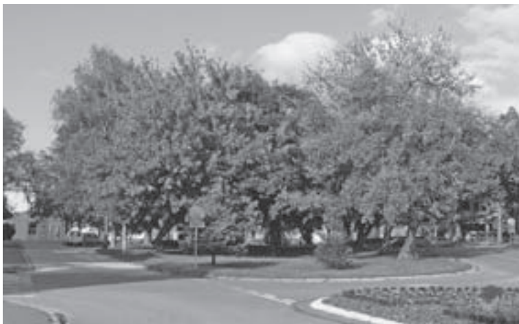
Slika 2. Velika aleja kestena (Aleja 1.) Figure 2 Horse chestnut avenue (Avenue 1)