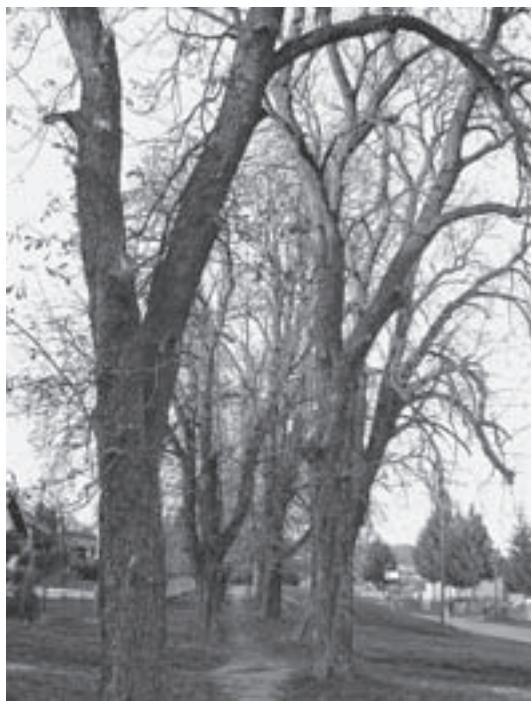
Slika 3. Gradski park Trg bana Josipa Jelačića Figure 2 City park Trg bana Josipa Jelačića

navedeni uzročnici prouzrokuju na drveću, kao i učestalost, uloga i utjecaj njihove pojave na istraživanim lokacijama. Jačina napada fitopatogenih gljiva bilježena je obzirom na zahvaćenost (zaraženost) krošanja. U obzir je uzeta i količina otpalog lišća tijekom mjeseca rujna dok je vegetacija još u tijeku. U slučaju stabala zaraženih pepelnicom, jakost napada svrstana je u tri kategorije: jak napad, ukoliko je pepelnicom zahvaćena čitava krošnja stabla i sive je boje; srednje jak napad, ako je površina zdrave i zaražene krošnje podjednaka; slab napad, kod većinom zdrave krošnje. Što se kukaca tiče, jačina napada određena je obzirom na oštećenost lisne površine i cijele krošnje ukoliko je bilo moguće. Zdravstveni pregled lokaliteta obavljen je još nekoliko puta tijekom 2007., u cilju bilježenja eventualno nastalih promjena.