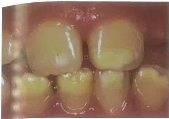
Slika 2. Manifestacija MIH-a na trajnim sjekutićima u vidu bjelkastih zamućenja cakline. (preuzeto iz 43)