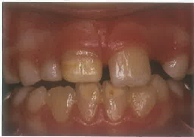
Slika 3. Žutosmeđi ograničeni opaciteti cakline trajnih sjekutića zahvaćenih MIH-om. (preuzeto iz 44)

sorbira se kost koja ih odjeljuje od mliječnih prethodnika te korijeni mliječnih zuba. Resorpcija, kao nekontinuirani proces, odvija se u intervalima ovisno o jačanju i slabljenju pritiska zuba u nicanju. Trajni zubi resorbiraju se isključivo uslijed patoloških procesa. Nema bitnijih razlika među spolovima u razvoju mliječnih zuba, dok je rast trajnih nasljednika brži u djevojčica. Budući da se hipomineralizacijske promjene u okviru MIH-a javljaju na trajnim sjekutićima i kutnjacima, valja poznavati vrijeme njihove pojave u usnoj šupljini. Nicanje prvih trajnih kutnjaka odvija se u dobi od 6-7 godina, a korijen je u potpunosti formiran između 9. i 10. godine. Donji sjekutići izrastaju tijekom 6.-8. godine, dok je razvoj korijena završen između 9. i 10. godine. Nicanje gornjih sjekutića slijedi između 7. i 9. godine života, dok završetak rasta korijena očekujemo s 10-11 godina. Drugi trajni kutnjaci započinju s nicanjem tijekom 11.-13. godine. Završetak razvoja korijena događa se od 14. do 16. godine života. Uspostavljanje okluzije nastaje ravnoteža mekih tkiva obraza i usnica izvana te jezika unutar usne šupljine (24).