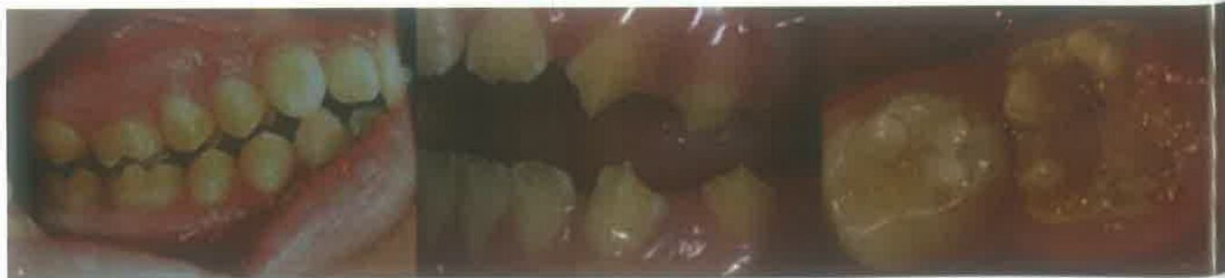
Slika 5. Amelogenesis imperfecta. (preuzeto iz 46)

Nakon pojave posterupcijskog loma, klinička slika može nalikovati hipoplaziji (Slika 4). MIH ponekad može izgledati poput dentalne fluoroze i amelogenesis imperfecta (AI) (Slika 5). Za fluorozu tipična difuzna zamućenja omogućuju razlikovanje od MIH-a, gdje su promjene ograničene. Kod fluoroze caklina je karijes otporna, dok je kod MIH-a podložnija njegovom nastanku (Slika 6). U vrlo teškim slučajevima MIH-a kutnjaci su jednako zahvaćeni, te oponašaju izgled AI-a s moguće prisutnim taurodontizmom. Izgled defekata u MIH-u bit će više asimetričan, dok kontralateralni zub