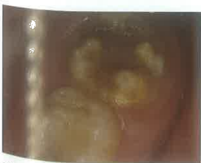
Slika 7. Zamućenja cakline i gubitak tvrdog zubnog tkiva trajnog kutnjaka zahvaćenog MIH-om. (preuzeto iz 48)

Brzo zahvaćenih prvih trajnih kutnjaka može varirati od 1-4, a izraženost promjena također može biti različita od zuba do zuba (49). Blaži defekti imaju tvrd, normalnu površinu, dok srednje naglašeni defekti mogu imati minimalan gubitak cakline te ne zahtijevaju restaurativan tretman. Zubi s jako izraženom kliničkom slikom pokazuju dezintegraciju cakline pa