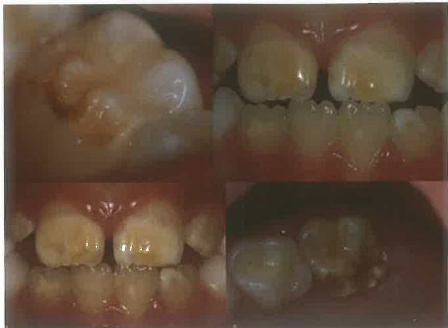
Slika 8. Klinička manifestacija MIH-a. (preuzeto iz 46)