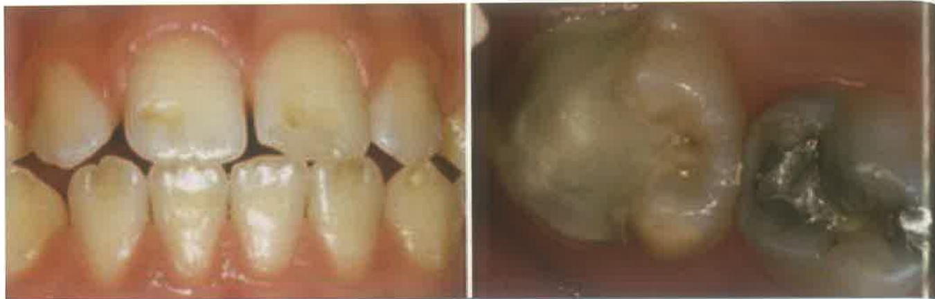
Slika 4. Hipoplazija cakline. (preuzeto iz 46)

resorptivnog potencijala ameloblasta i inhibicije proteolitičkih enzima, što dovodi do retencije proteina te manjka kalcij fosfata (25).