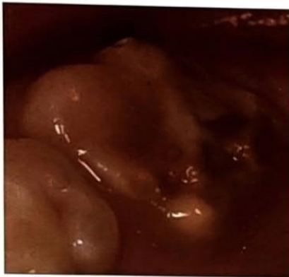
Slika 1. Promjene na prvom trajnom kutnjaku zahvaćenom MIH-om. (preuzeto iz 43)

[2] Zavod za dječju i preventivnu stomatologiju, Stomatološki fakultet Sveučilišta u Zagrebu