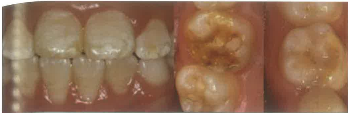
Slika 6. Dentalna fluoroza. (preuzeto iz 46)

ne mora ili može biti umjereno do jače oštećen (4) (slika 7, 8).