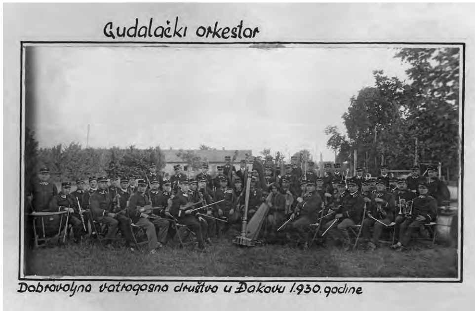
Slika 2: Gudalački orkestar Dobrovoljnog vatrogasnog društva u Đakovu 1930. godine, fotografija

fonijskog sastava nije bio moguć zbog toga što je gradivo Dobrovoljnog vatrogasnog društva izgubljeno, 137 no postoji podatak o tome da je orkestar vodio kapelnik Josip Faletić. 138