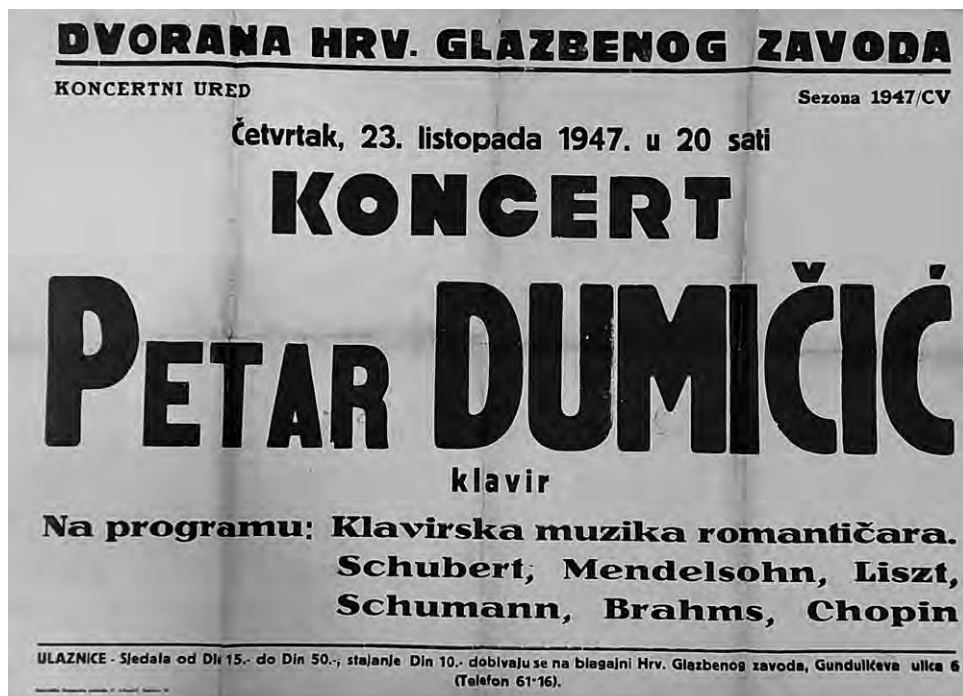
Slika 3: Plakat s najavom koncerta Petra Dumičića, Knjižnica Muzičke akademije Sveučilišta u Zagrebu, Osobni fond Petar Dumičić, sign. HR-MUZA-3.