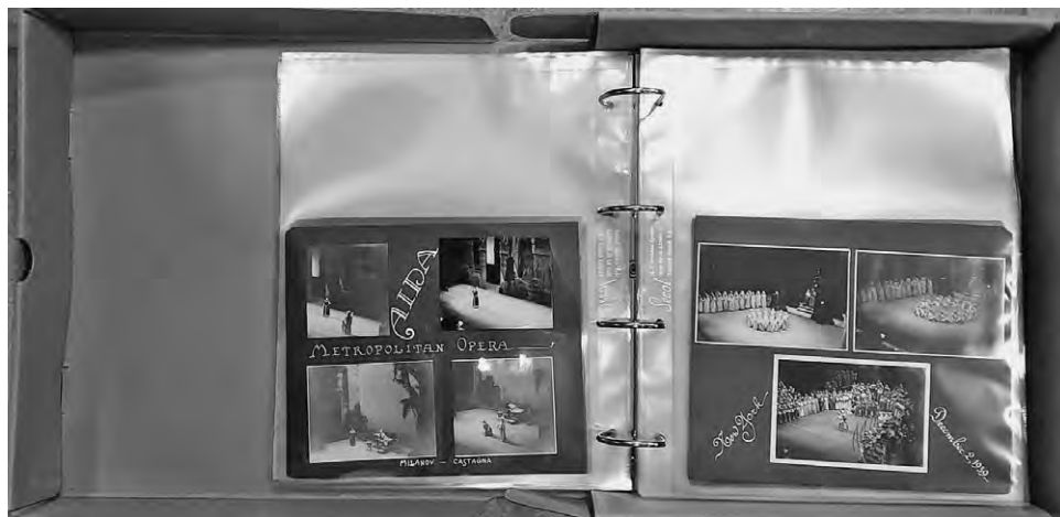
Slika 4: Stranice fotoalbuma iz Osobnog fonda Zinka Kunc (Milanov). Knjižnica Muzičke akademije Sveučilišta u Zagrebu, Osobni fond Zinka Kunc (Milanov), sign. HR-MUZA-4. Autori fotografija iz fotoalbuma nisu poznati.

pilena. Uz fotoalbum je pristigao i jedan fascikl s 51 fotografijom od kojih su neke datirane, a nastale su 1937-1967. Gotovo su sve fotografije crno-bijele, a među njima ima i obiteljskih, kao i fotografija s nastupa i raznih događanja kojima je Zinka Kunc prisustvovala. Osim fotografija, s materijalima je preuzet i jedan ručno oslikani portret Zinke Kunc s naznačenim datumom i mjestom »Rim, 1955.«, a potpis autora nije čitak.