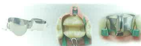
Slika 8. Kerr metrafix matrice