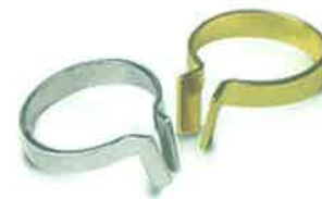
Slika 11. Omni-matrix sekcionalne matrice