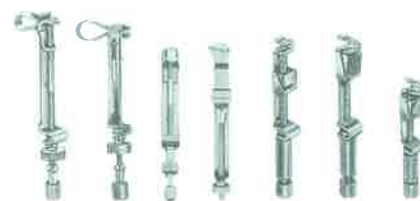
Slika 3. Tofflemire matrica i držač