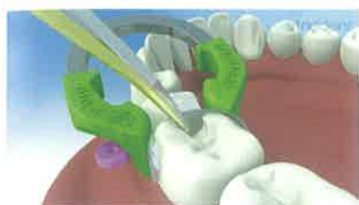
Slika 6. Sekcijske matrice