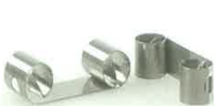
Slika 10. Inter-guard matrice