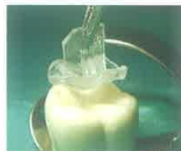
Slika 13. Okluzalna matrica