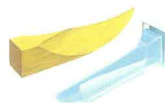
Slika 15. Interdentalni klinovi i kolčići