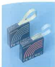
Slika 1. Celuloidna matrica