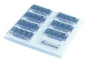
Slika 12. FaciForm Dental Matrice