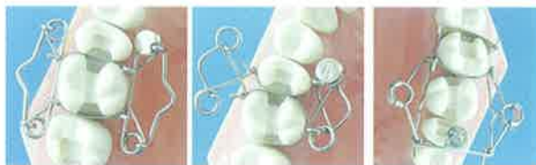
Slika 5a i 5b. Walsler matrica