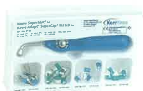
Slika 4. Hawe supermat