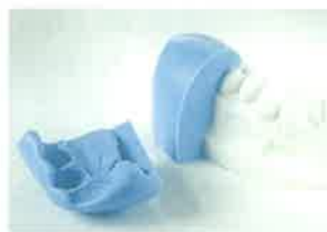
Slika 14. Silikonski ključ