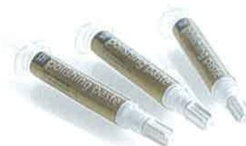
Slika 8. Paste za poliranje. Preuzeto iz (19)