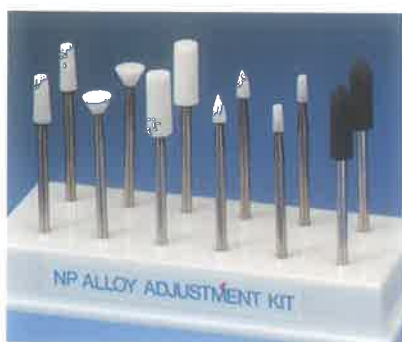
Slika 3. Kamenčići za poliranje. Preuzeto iz (14)