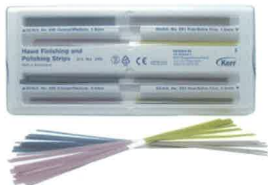
Slika 5. Trakice za poliranje. Preuzeto iz (16)