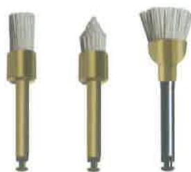
Slika 7. Četkice za poliranje. Preuzeto iz (18)