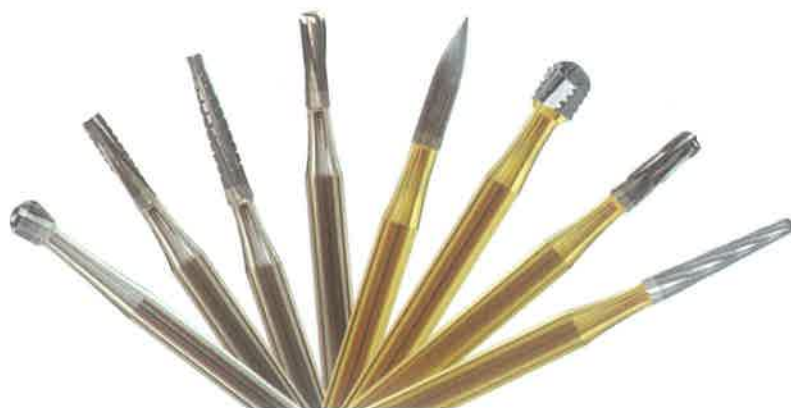
Slika 2. Karbidna svrdla. Preuzeto iz (13)