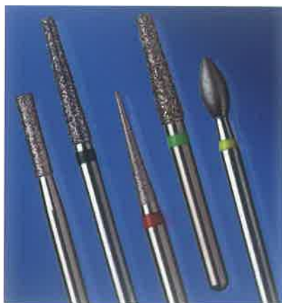
Slika 1. Dijamantna svrdla. Preuzeto iz (12)