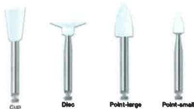
Slika 6. Gumice za poliranje. Preuzeto iz (17)