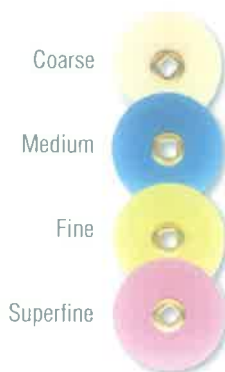
Slika 4. Diskovi za poliranje. Preuzeto iz (15)