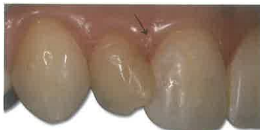
Slika 2. Gingivitis