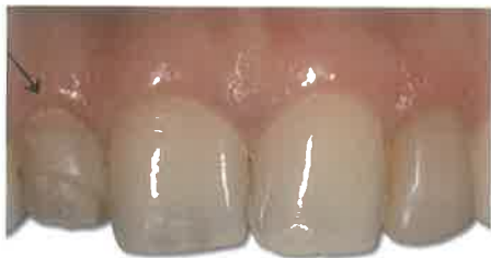
Slika 1. Gingivitis uz vidljiv plak