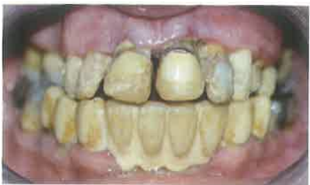
Slika 3. Parodontitis